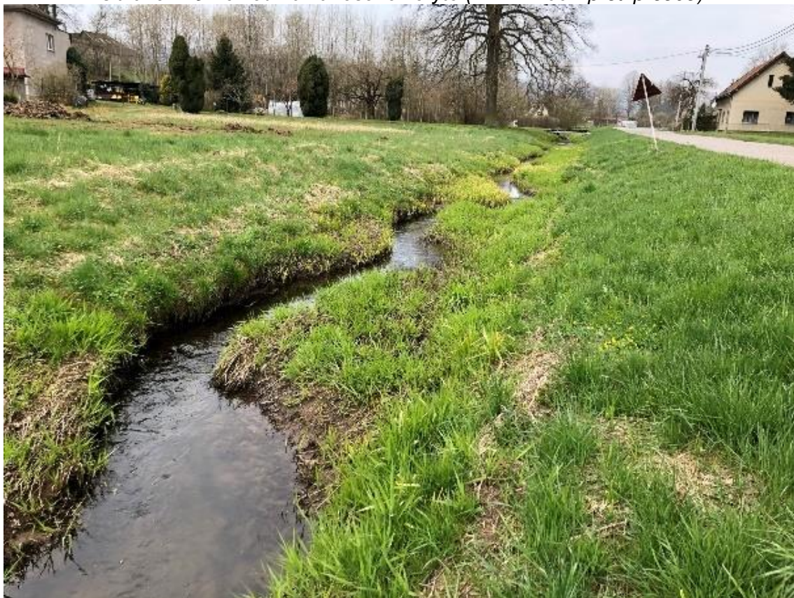
Obrázek 20 Pohled na nánosy v korytě (ř.km 7.750 - proti proudu)