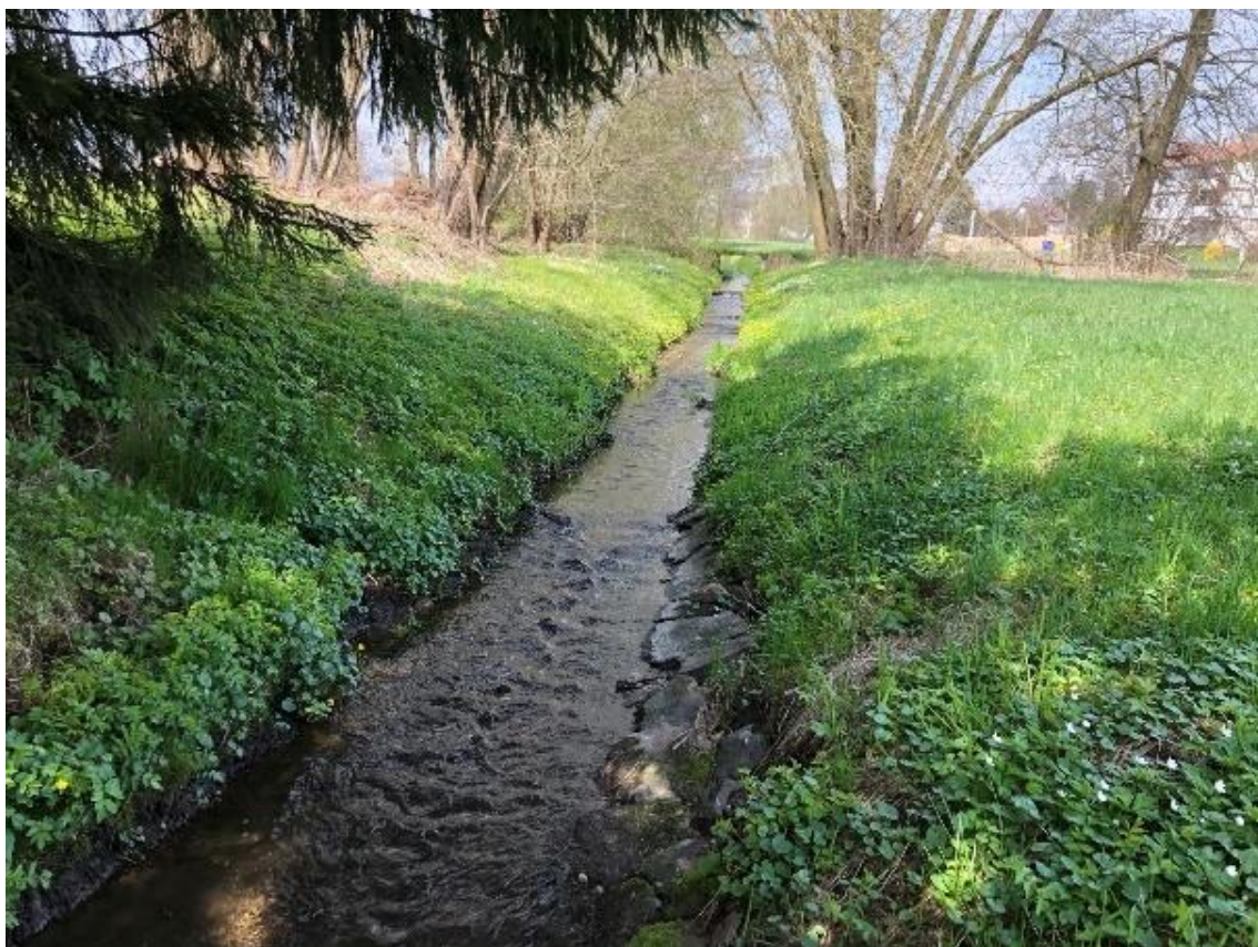
Obrázek 69 Pohled na přímý úsek vodního toku (ř.km 9.600 - proti proudu)