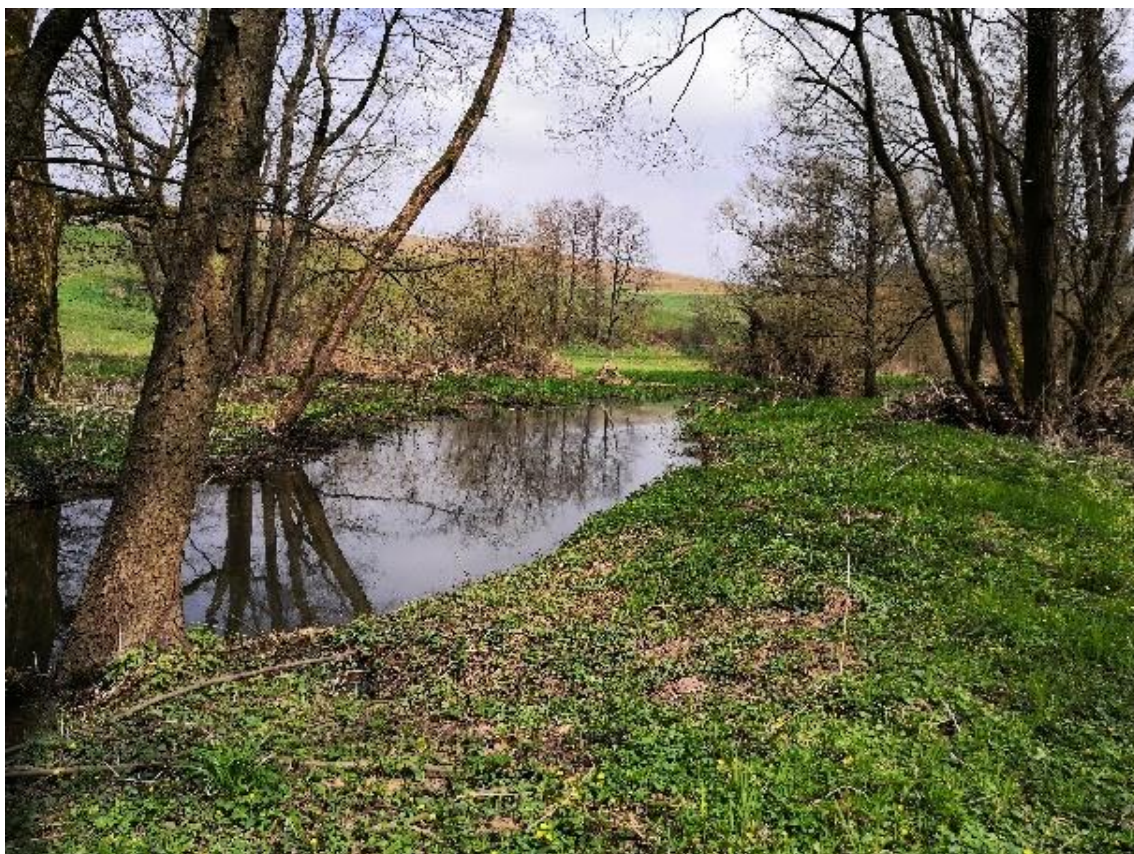
Obrázek 5 Pohled na vzdutou hladinu v korytě (ř.km 7.150 - po proudu)