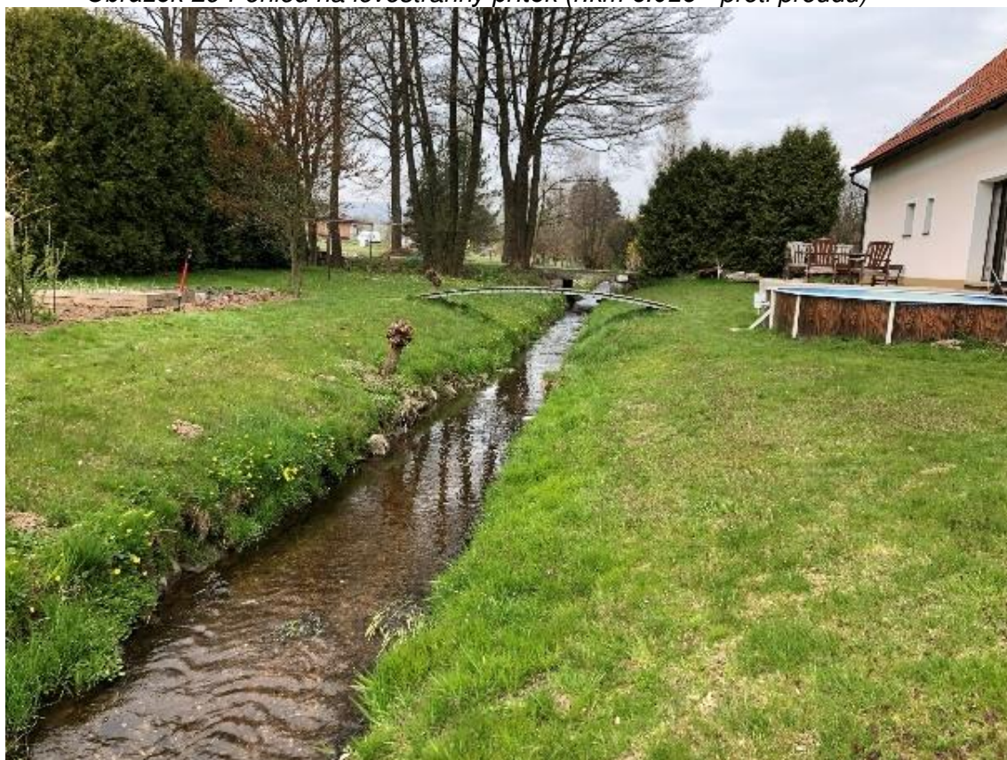
Obrázek 30 Pohled na lávku (ř.km 8.050 - proti proudu)