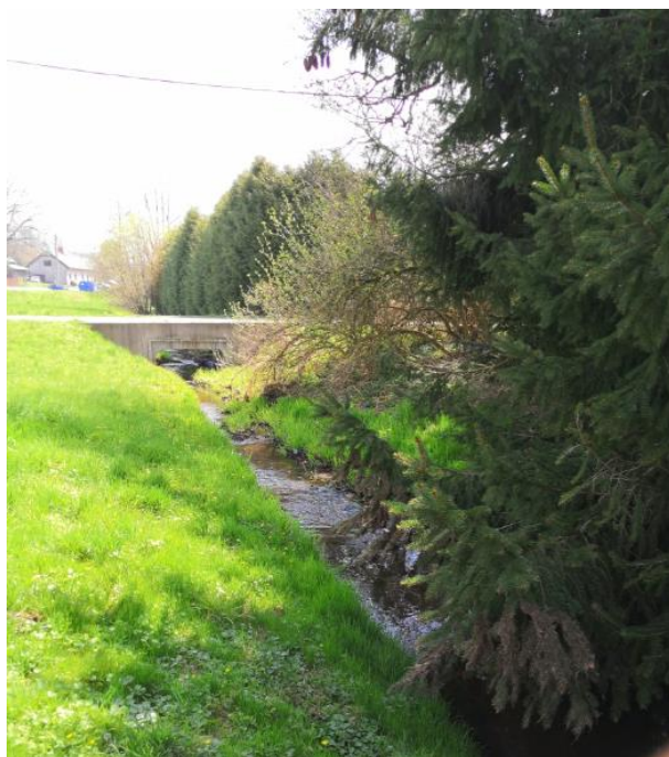
Obrázek 63 Pohled na zarostlý vodní tok (ř.km 9.470 - po proudu)