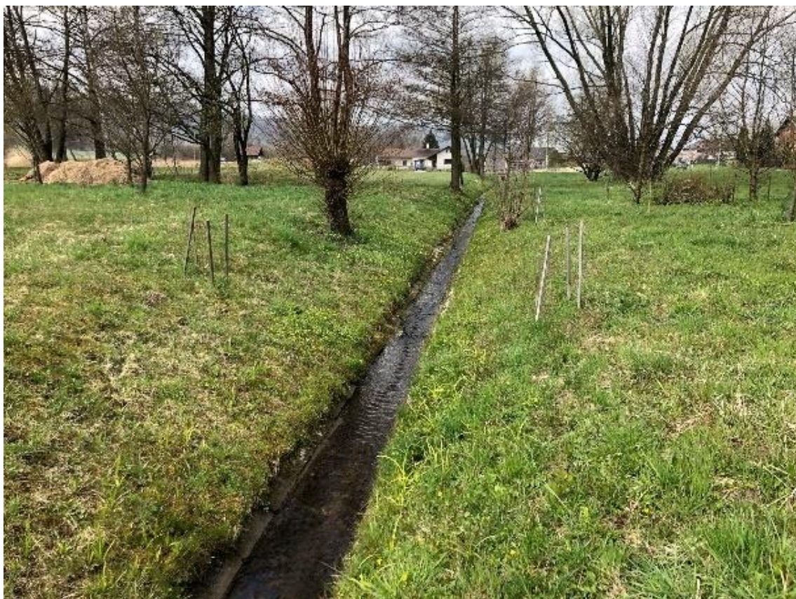
Obrázek 105 Pohled na koryto opevněné bet. žlabem ve dně (ř.km 11.300 - proti proudu)