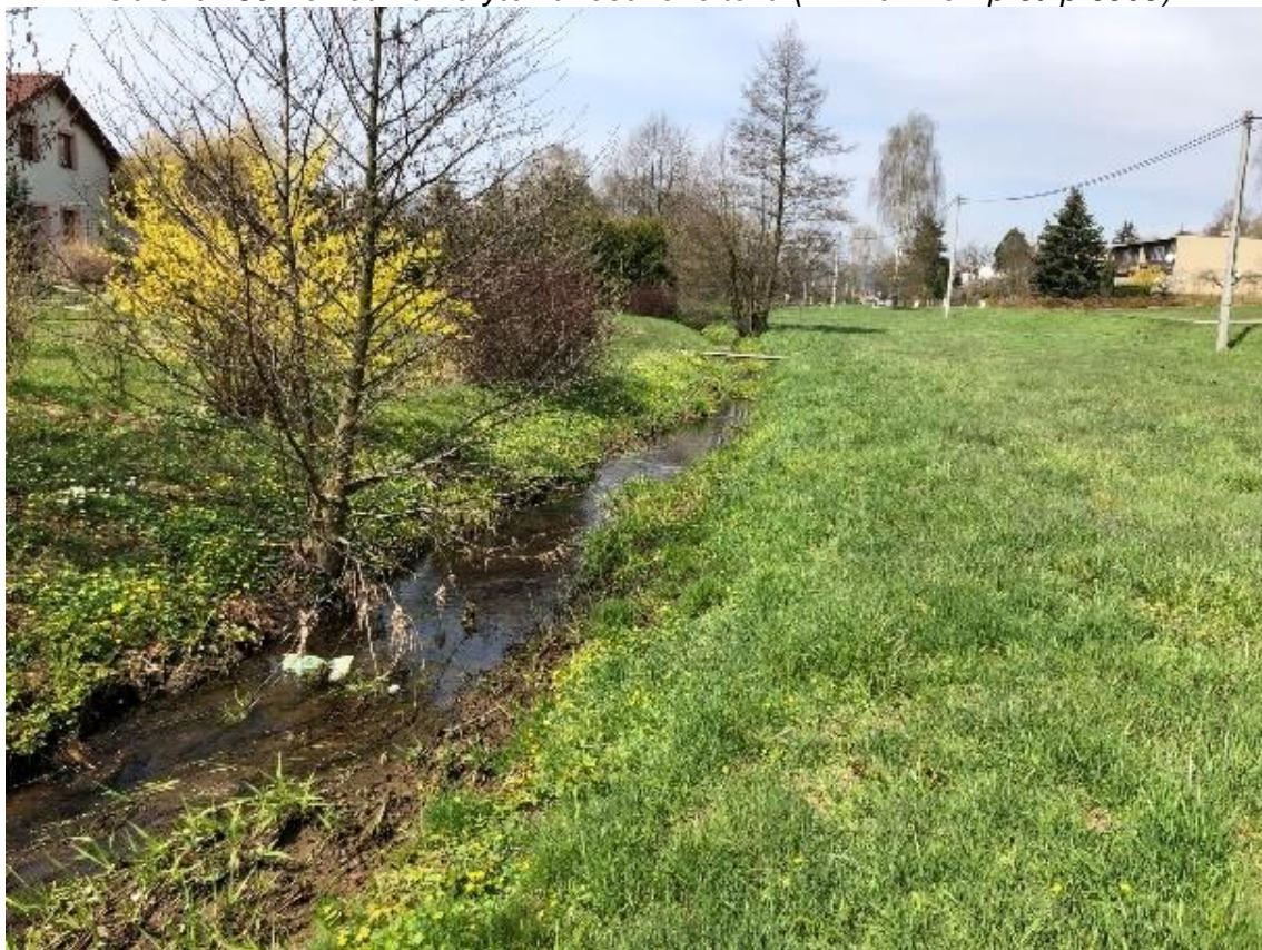
Obrázek 60 Pohled na koryto zaneseného toku (ř.km 9.320 - proti proudu)