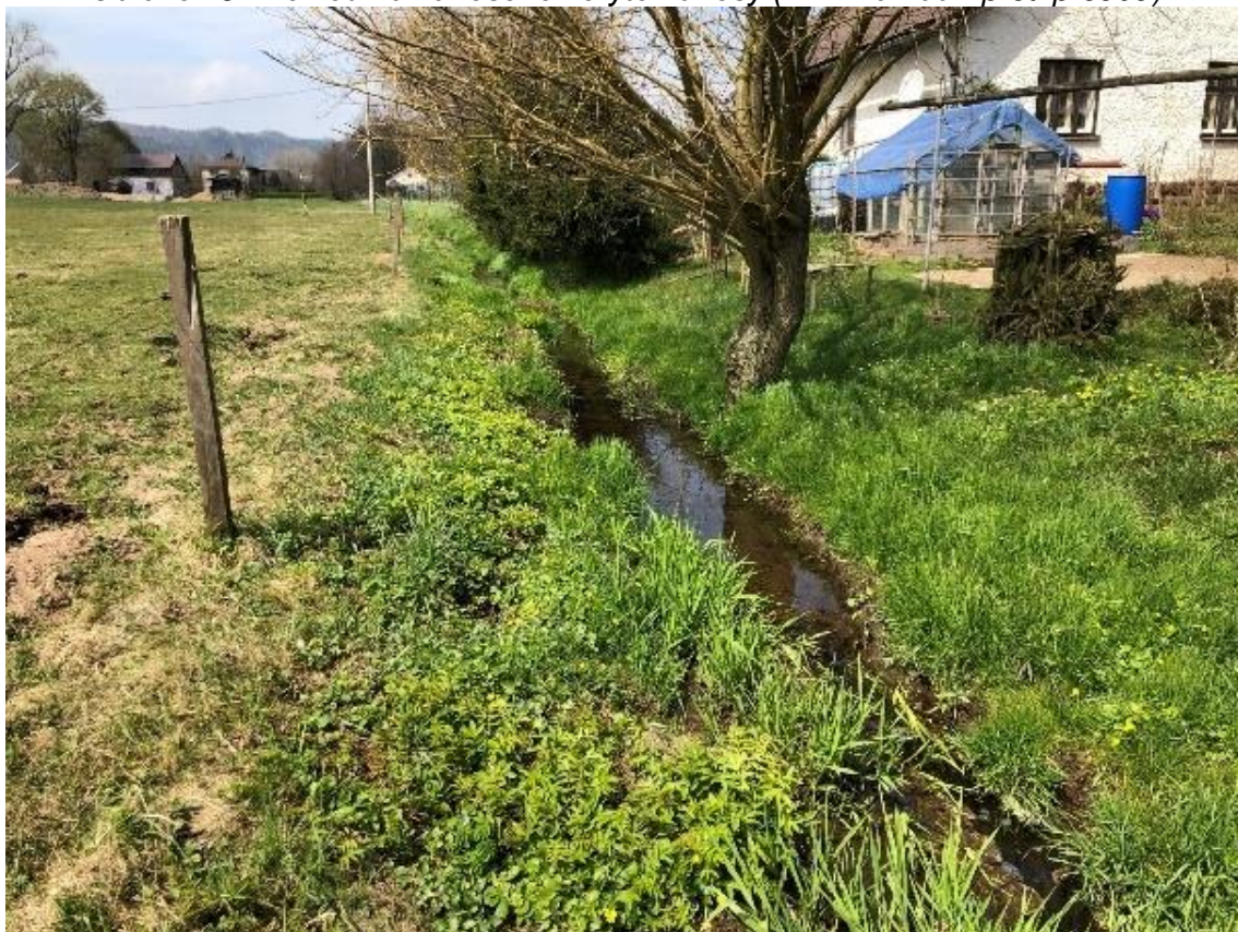
Obrázek 82 Pohled na zanesené koryto nánosy (ř.km 10.140 - proti proudu)