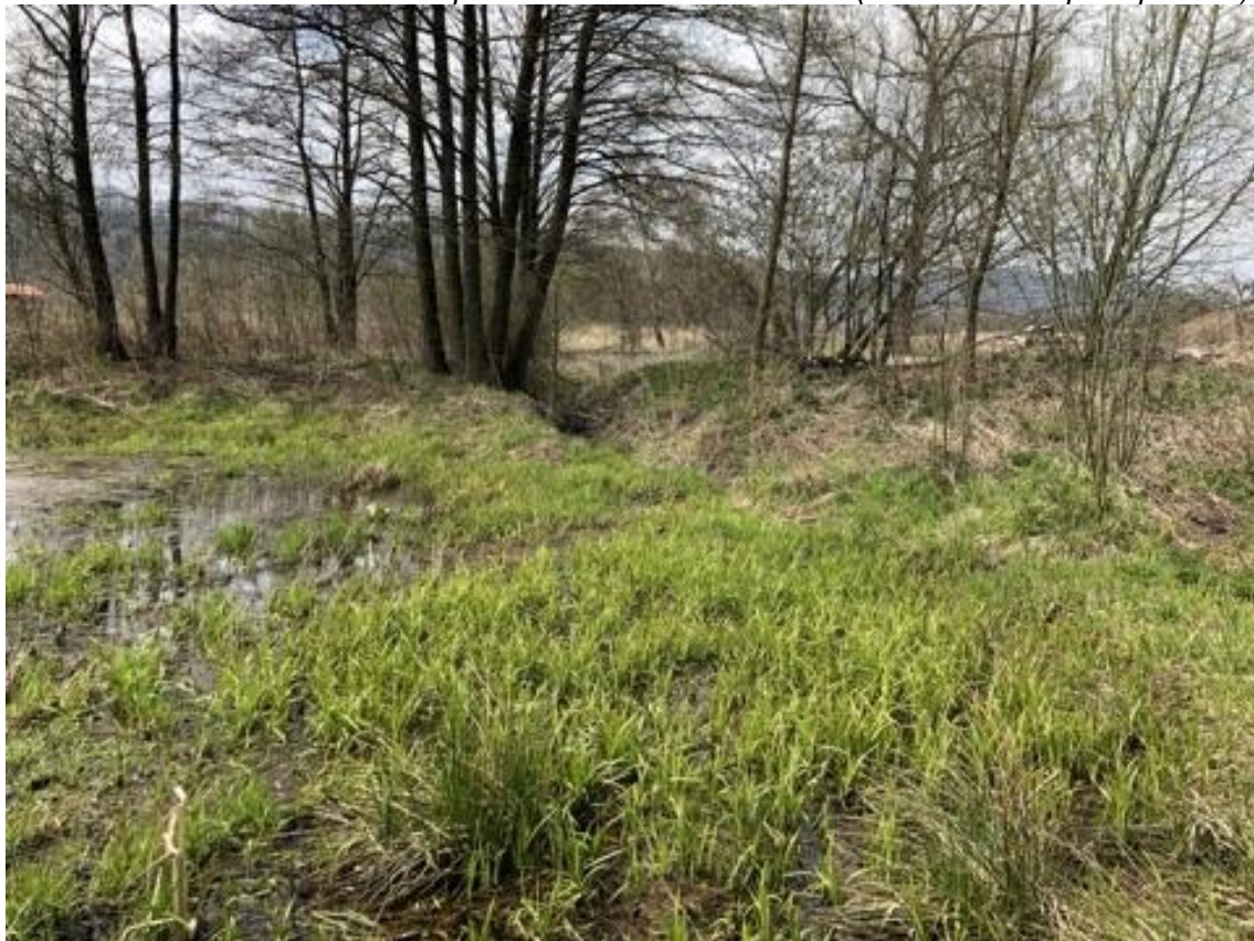
Obrázek 112 Pohled na vodní plochu (ř.km 11.650 - proti proudu)