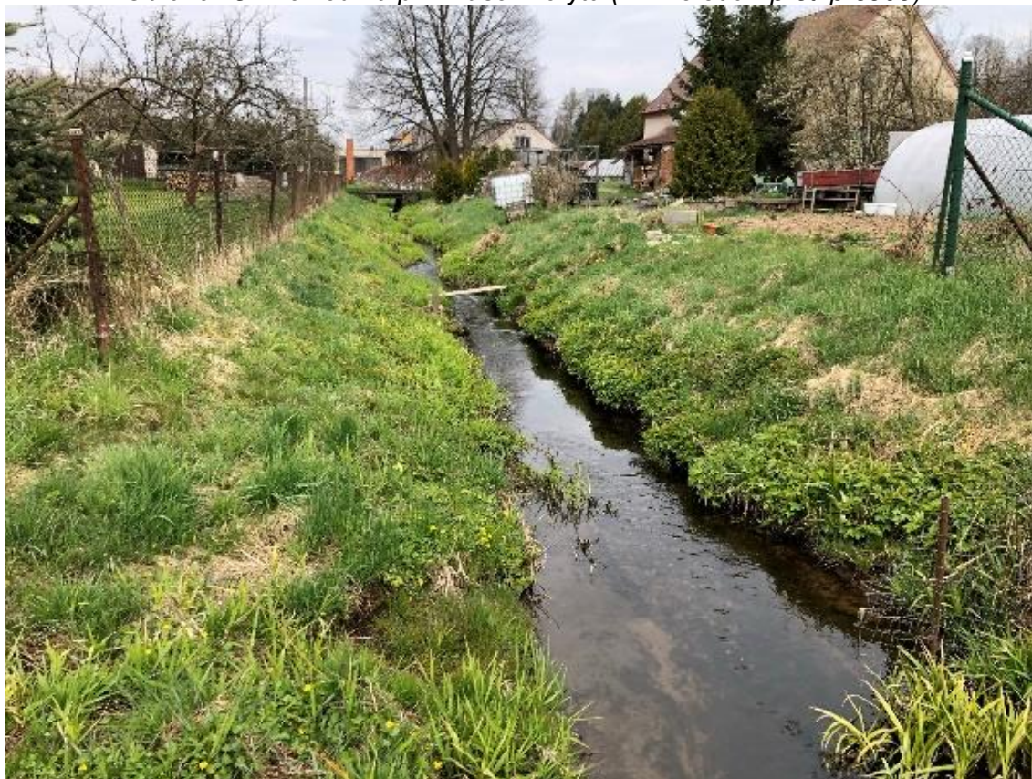
Obrázek 38 Pohled na tok (ř.km 8.350 - proti proudu)