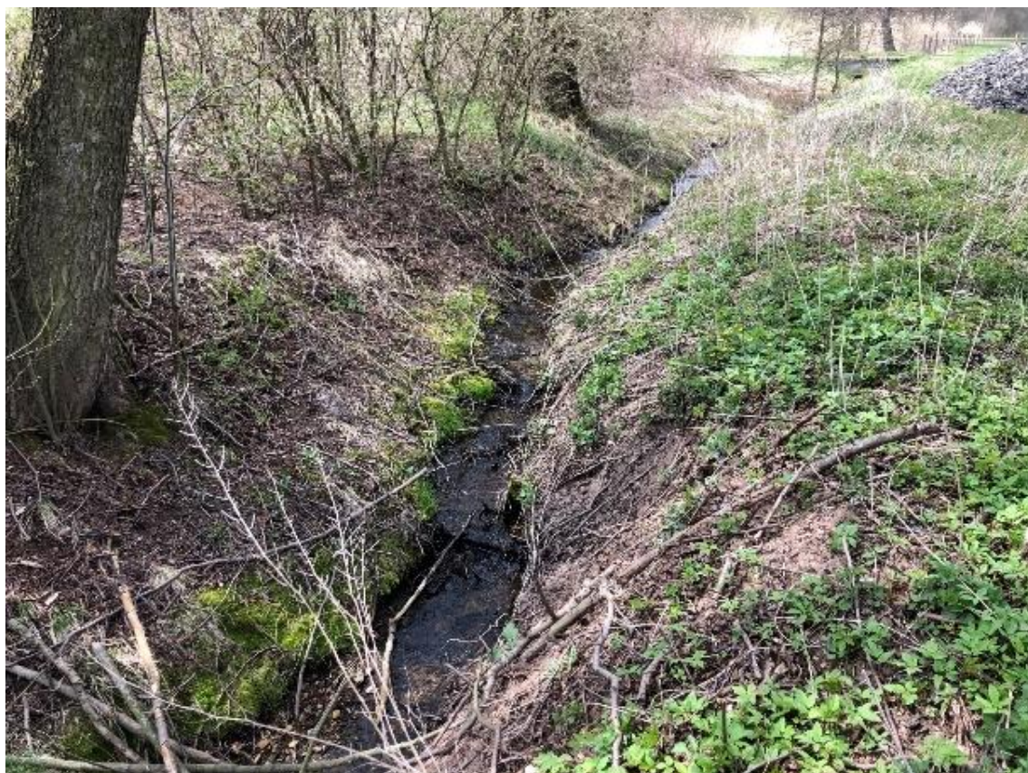
Obrázek 115 Pohled na přítok do vodní plochy (ř.km 10.590 - proti proudu)