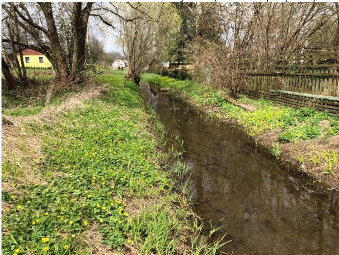
Obrázek 34 Pohled na neudržované koryto toku (ř.km 8.200 - proti proudu)