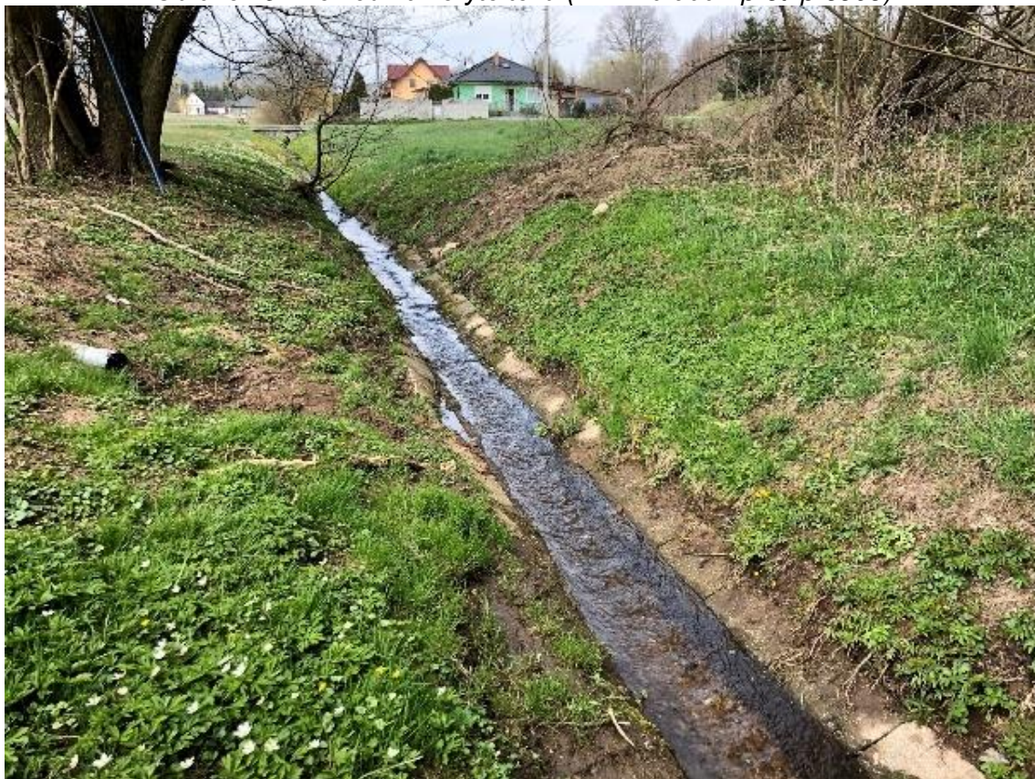
Obrázek 98 Pohled na opevněné koryto (ř.km 10.930 - proti proudu)