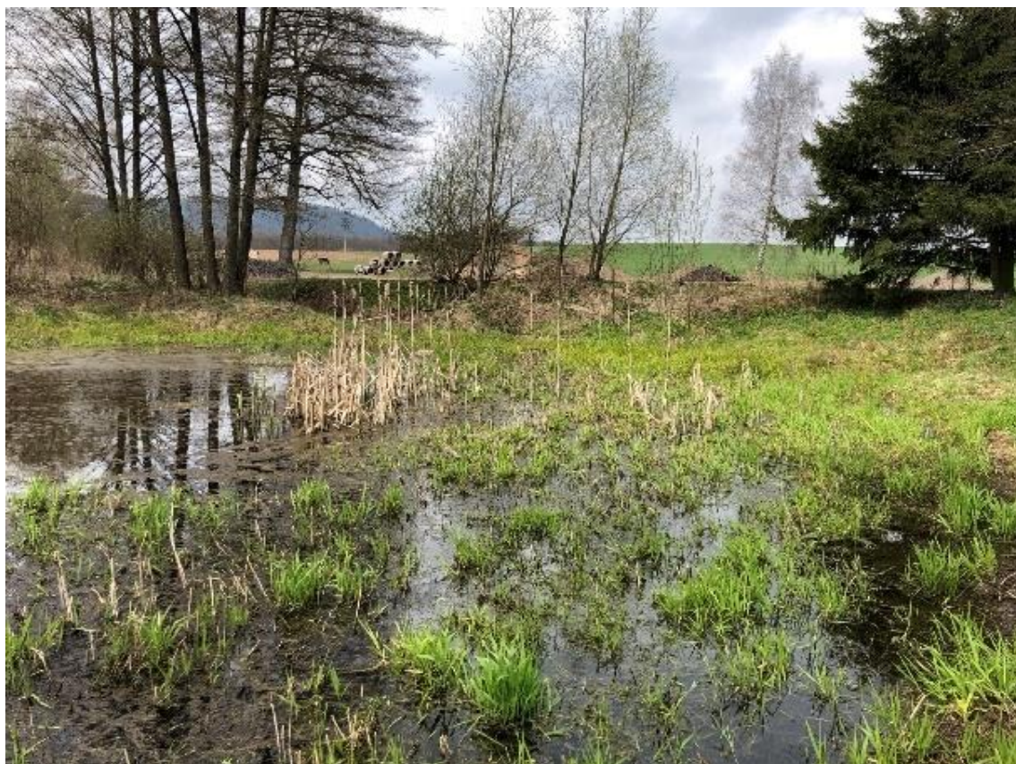
Obrázek 113 Pohled na vodní plochu (ř.km 11.670 - proti proudu)