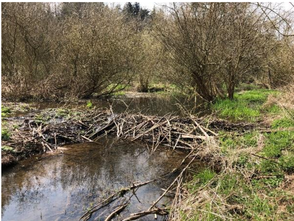
Obrázek 3 Pohled na bobří hráz (ř.km 7.120 – proti proudu)