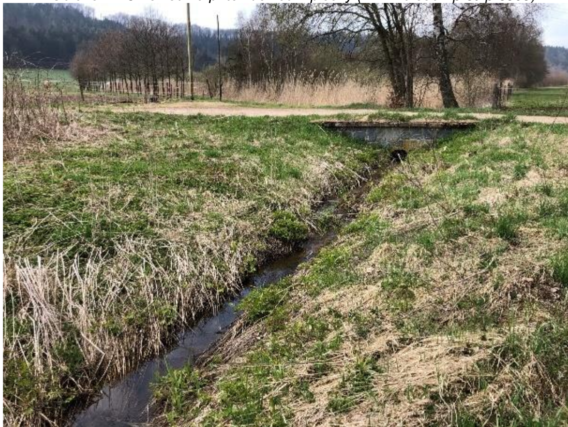
Obrázek 116 Pohled na koryto s bet. propustkem v pozadí (ř.km 11.705 - proti proudu)