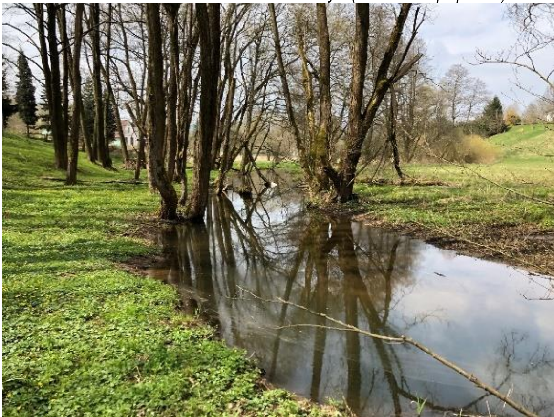
Obrázek 6 Pohled na vzdutou hladinu v korytě (ř.km 7.150 - proti proudu)