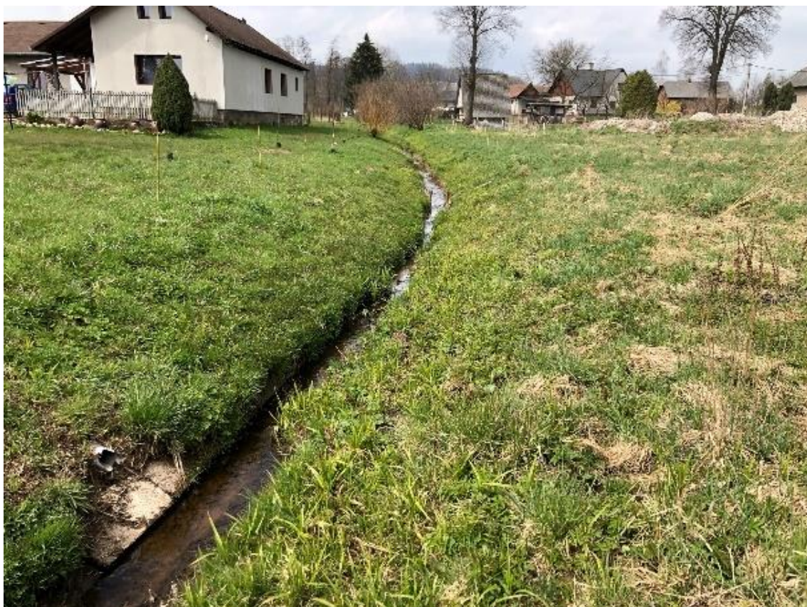
Obrázek 107 Pohled na zarostlé koryto (ř.km 11.430 - proti proudu)