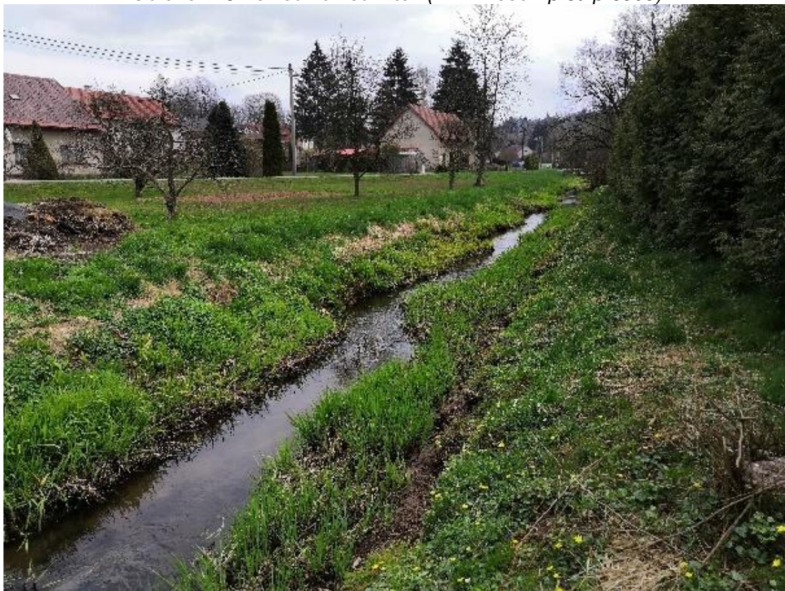
Obrázek 26 Pohled na vodní tok (ř.km 7.900 - po proudu)