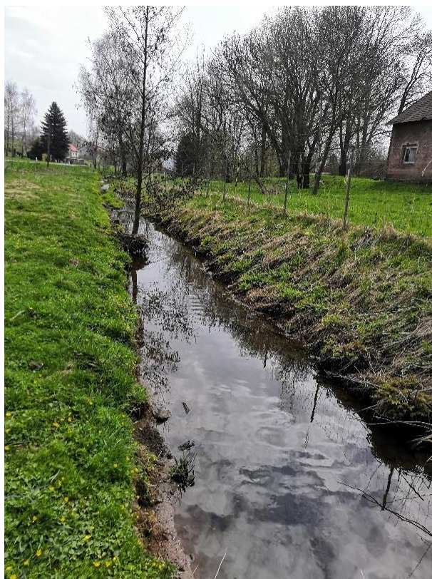
Obrázek 53 Pohled na koryto toku (ř.km 9.000 - po proudu)