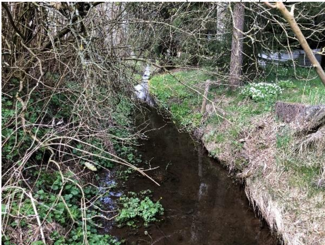
Obrázek 96 Pohled na koryto toku (ř.km 10.850 - po proudu)