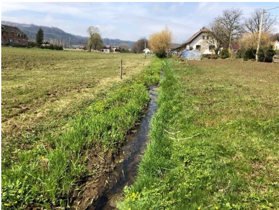
Obrázek 81 Pohled na zanesené koryto nánosy (ř.km 10.100 - proti proudu)