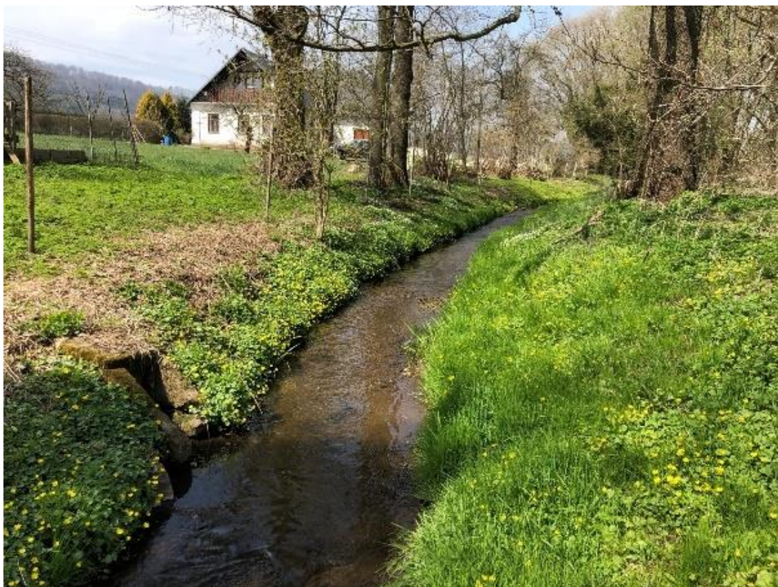
Obrázek 67 Pohled na koryto vodního toku (ř.km 9.550 - proti proudu)