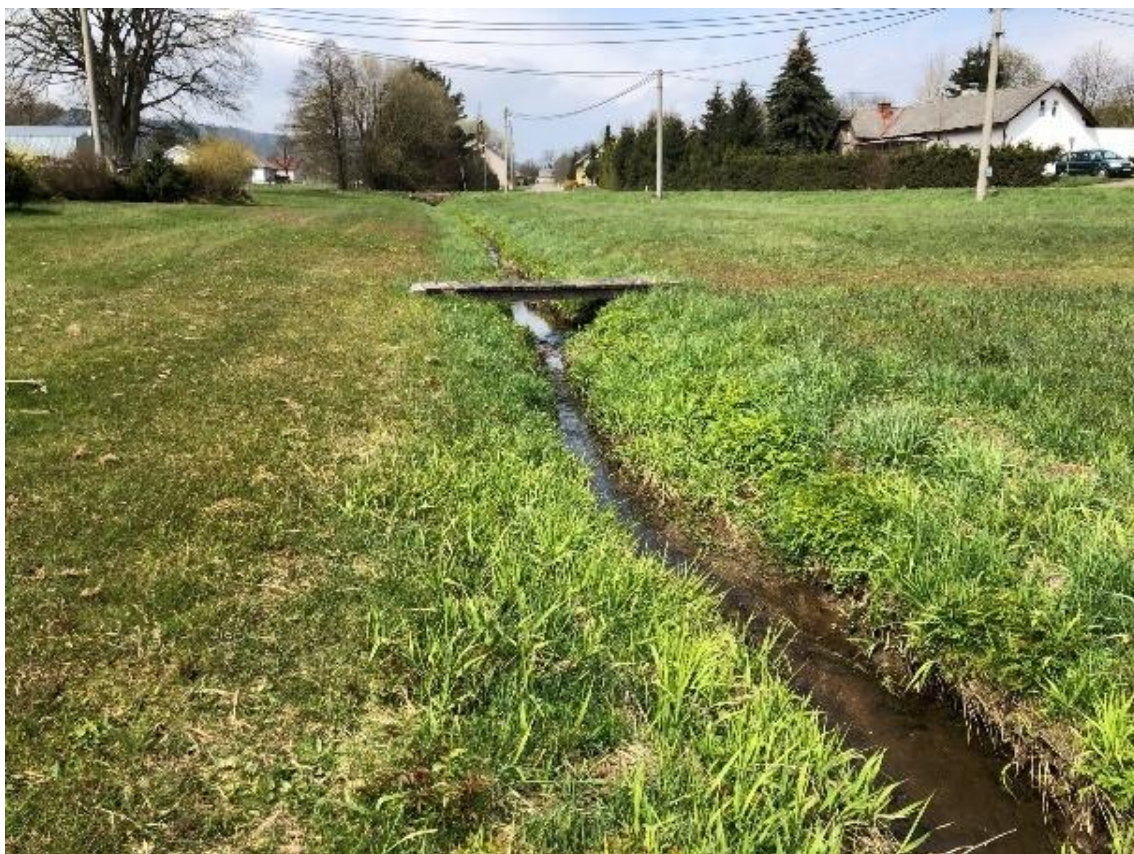
Obrázek 91 Pohled na zarostlé koryto toku (ř.km 10.700 - proti proudu)