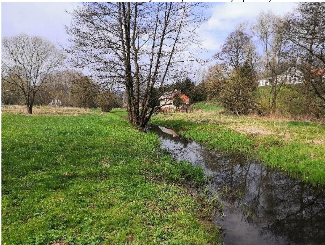
Obrázek 8 Pohled na koryto toku (ř.km 7.230 - proti proudu)