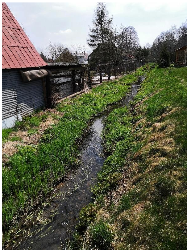
Obrázek 57 Pohled na zanesené koryto vodního toku (ř.km 9.170 - po proudu)