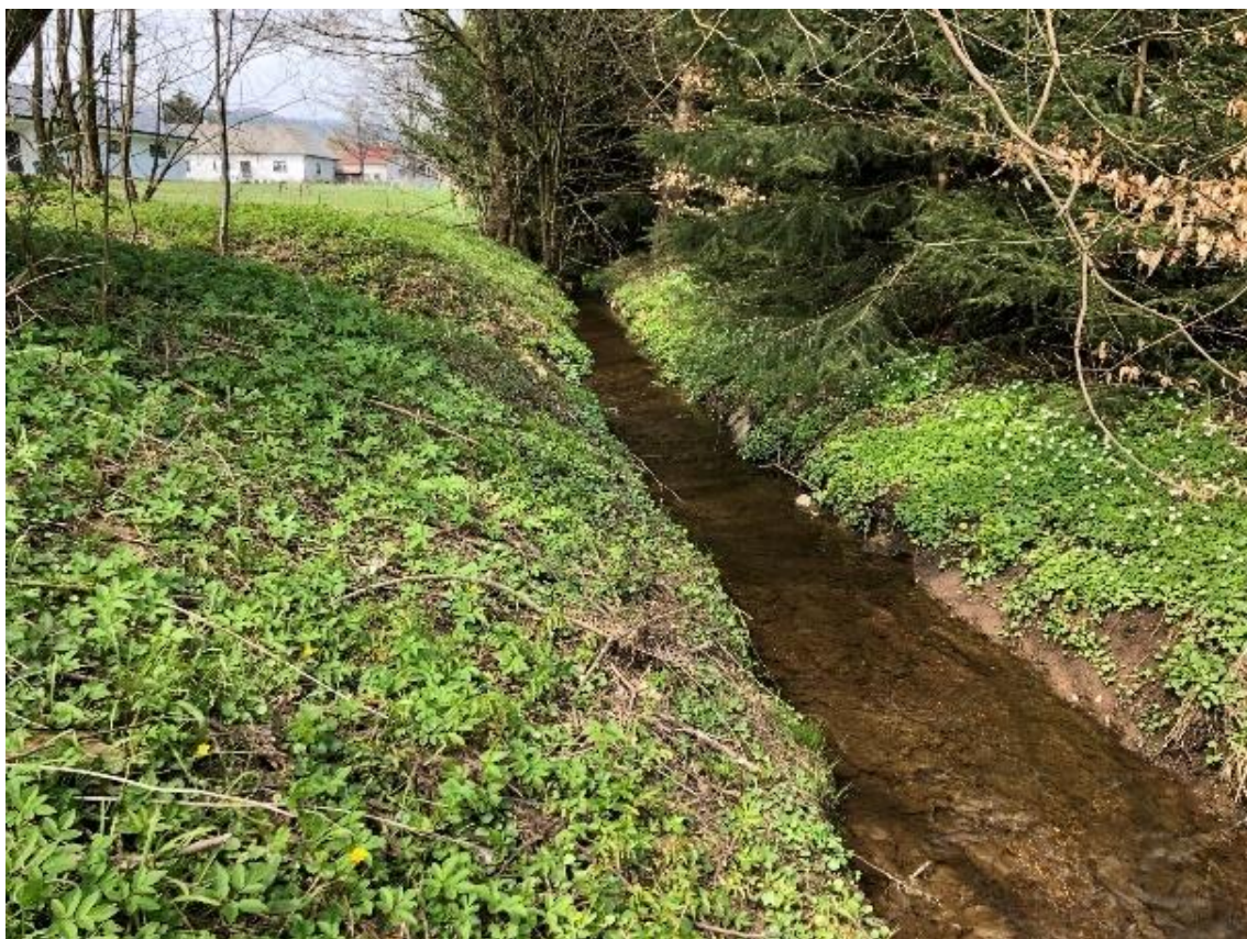
Obrázek 93 Pohled na koryto vodního toku (ř.km 10.780 - proti proudu)