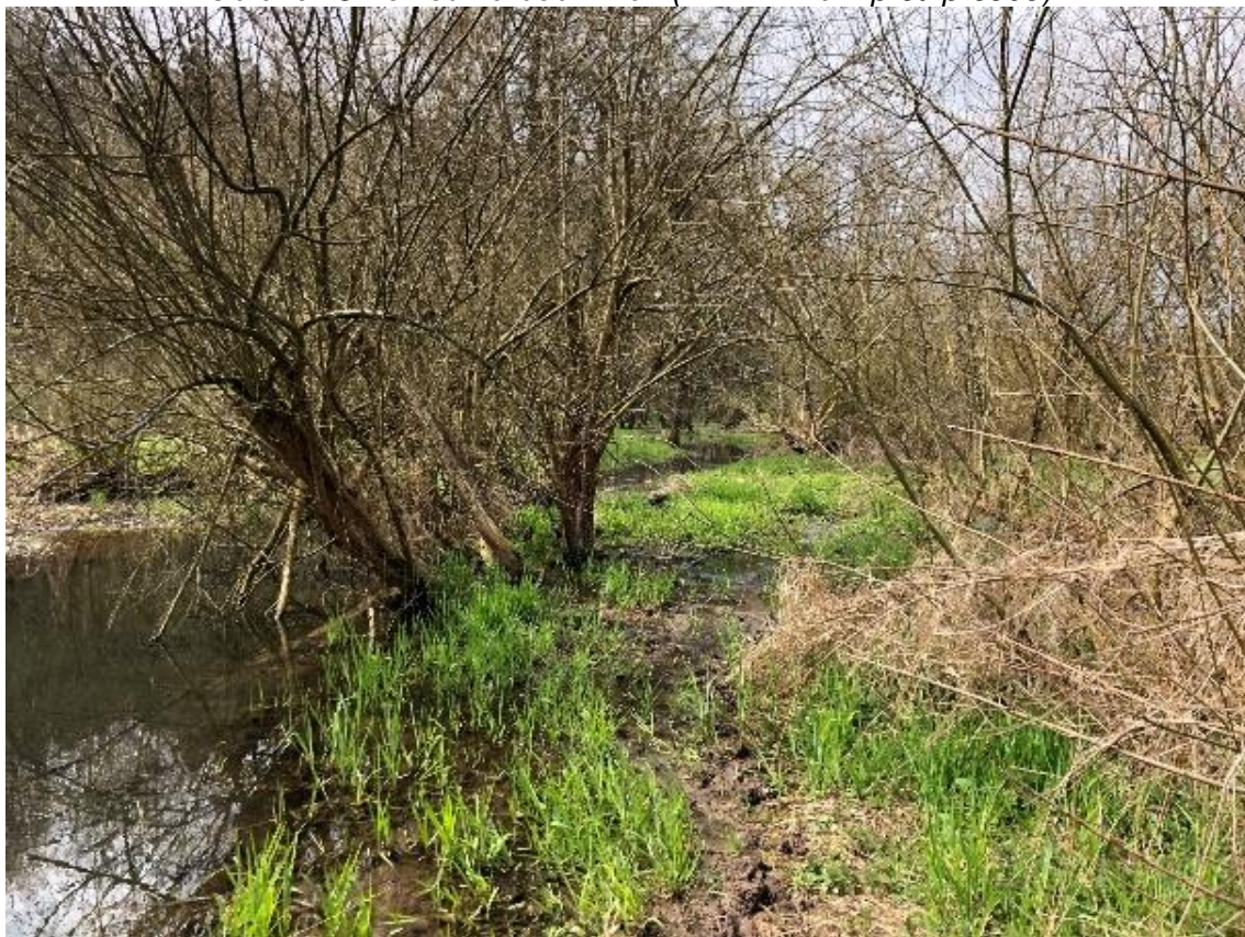
Obrázek 4 Pohled na zarostlou část břehu (ř.km 7.130 - proti proudu)