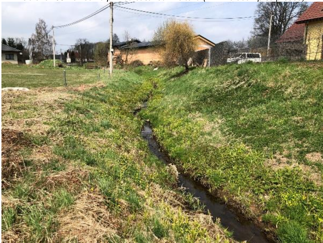
Obrázek 100 Pohled na koryto vodního toku (ř.km 11.000 - proti proudu)