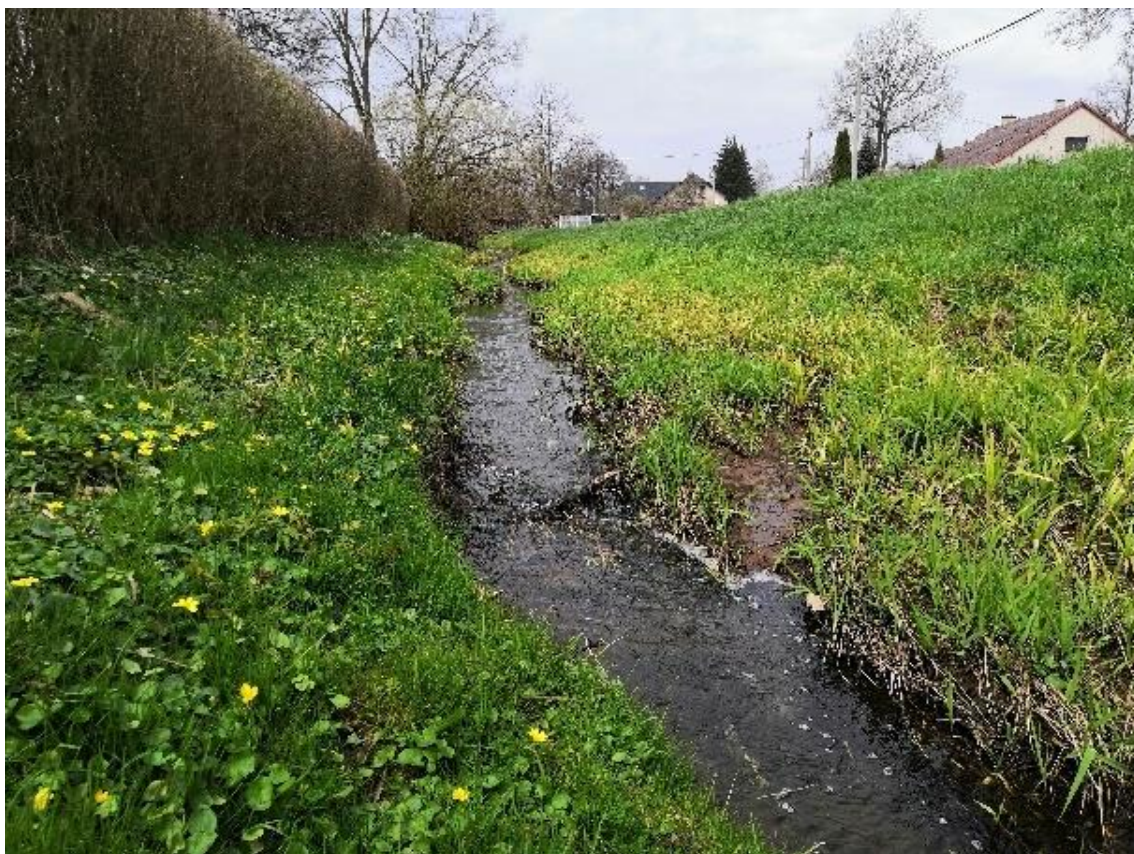
Obrázek 23 Pohled na nánosy v korytě (ř.km 7.800 - proti proudu)