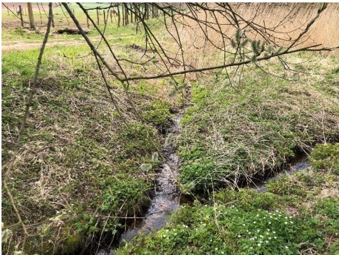
Obrázek 117 Pohled na levostranný přítok (ř.km 11.735 – proti proudu)