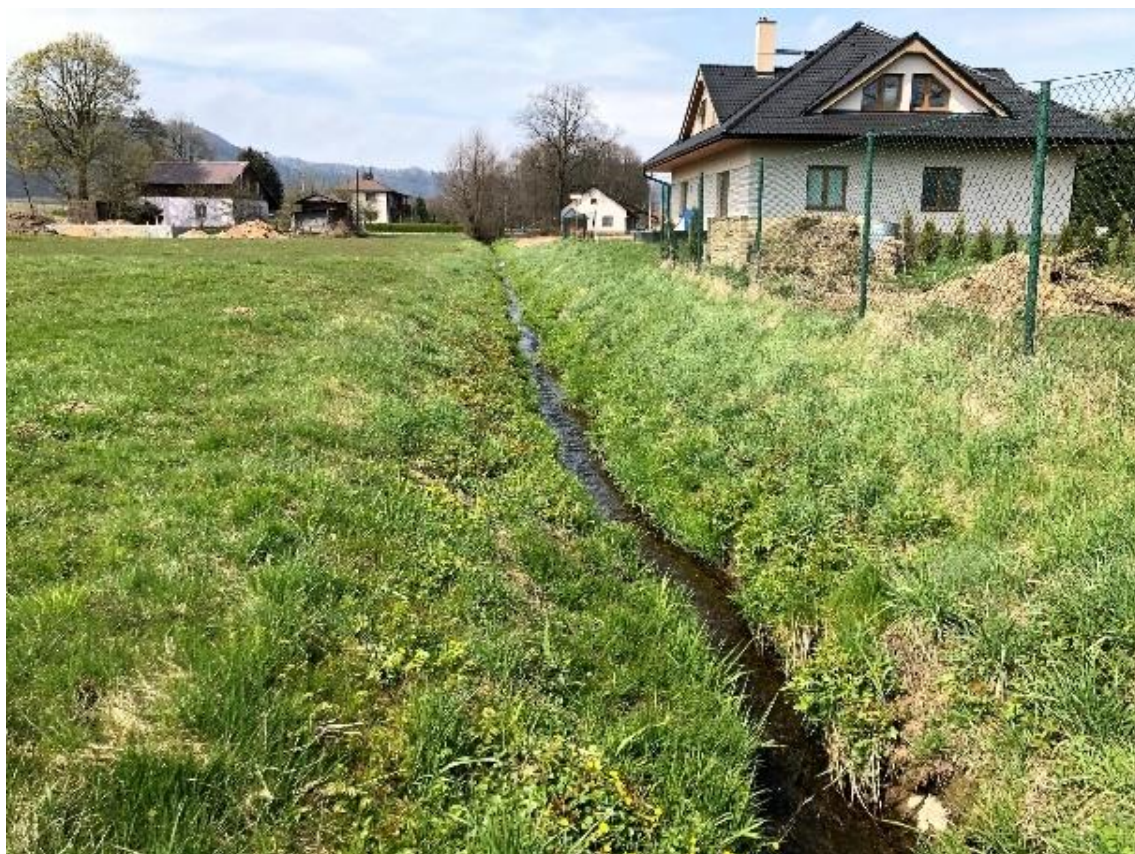
Obrázek 85 Pohled na přímou část vodního toku (ř.km 10.350 - proti proudu)