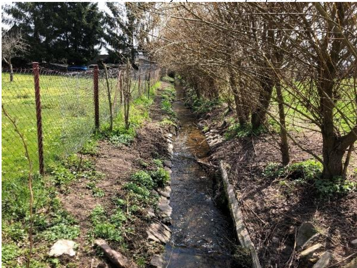
Obrázek 80 Pohled na koryto (ř.km 10.100 - po proudu)