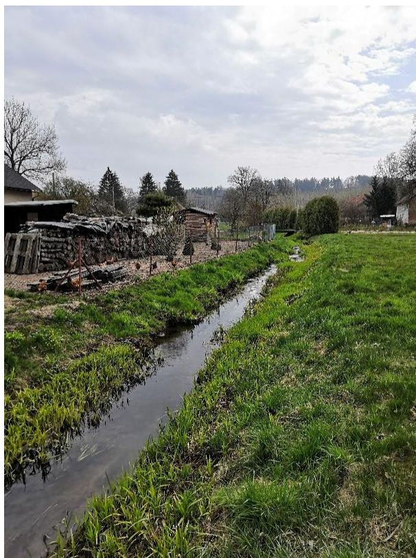
Obrázek 27 Pohled na zarostlé koryto (ř.km 7.950 - po proudu)