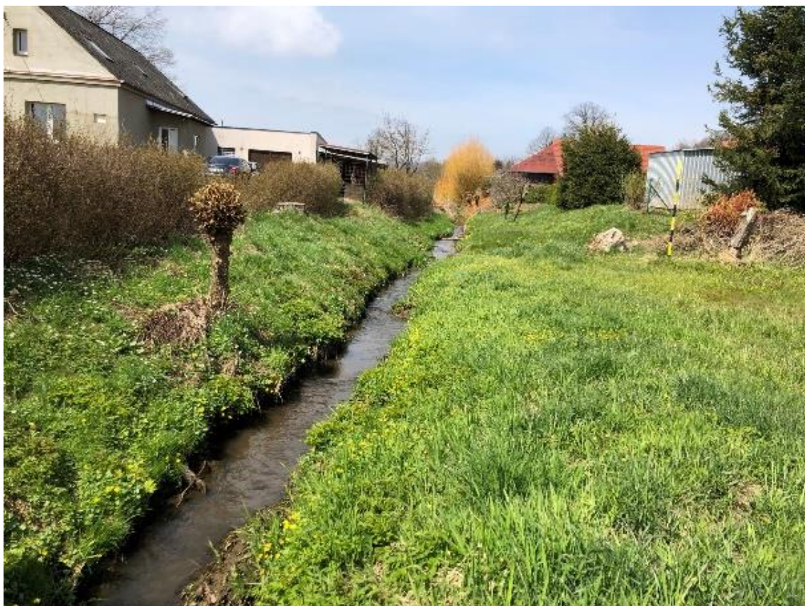
Obrázek 75 Pohled na koryto (ř.km 9.850 - proti proudu)