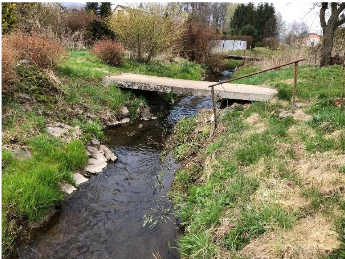
Obrázek 47 Pohled na betonovou lávku (ř.km 8.725 - proti proudu)