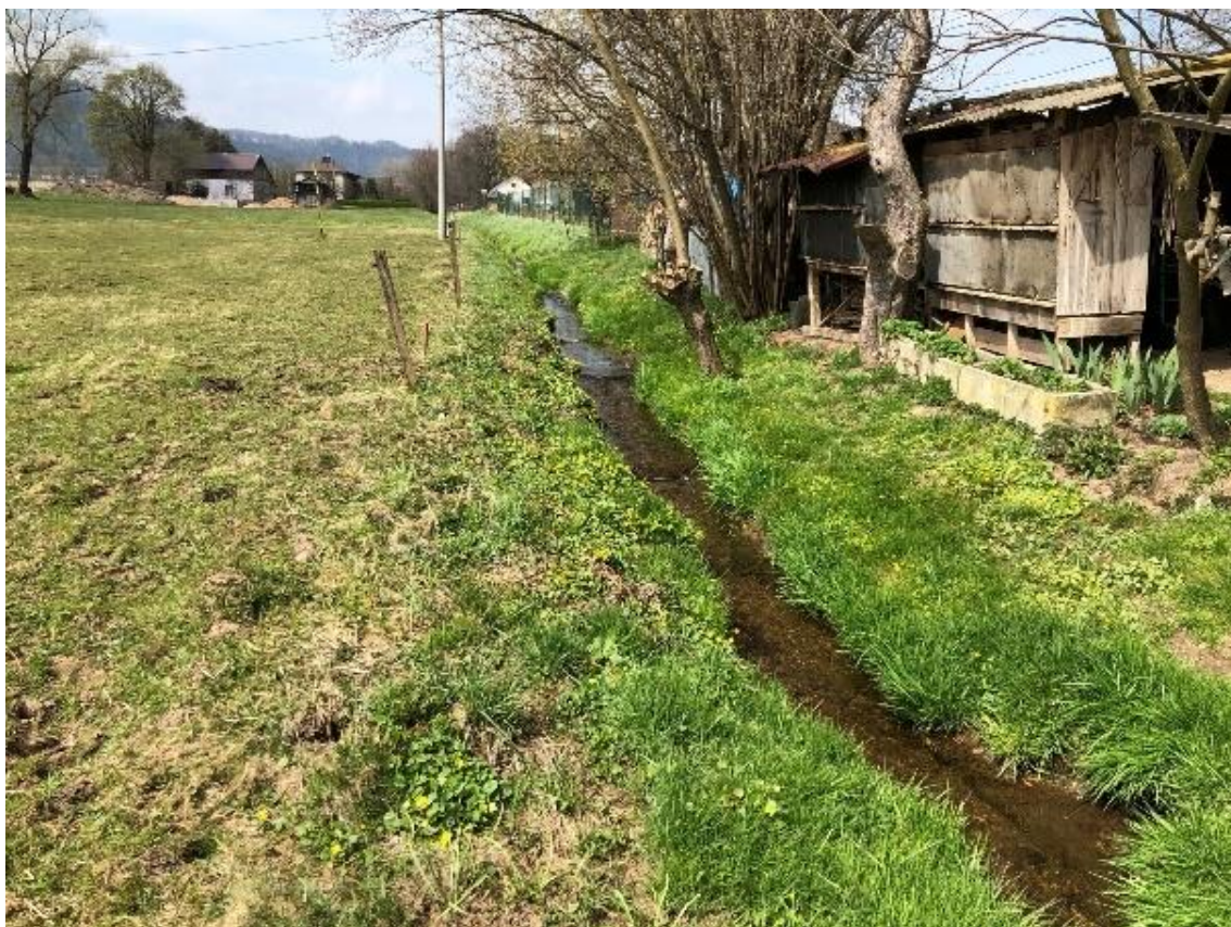
Obrázek 83 Pohled na koryto toku (ř.km 10.200 - proti proudu)