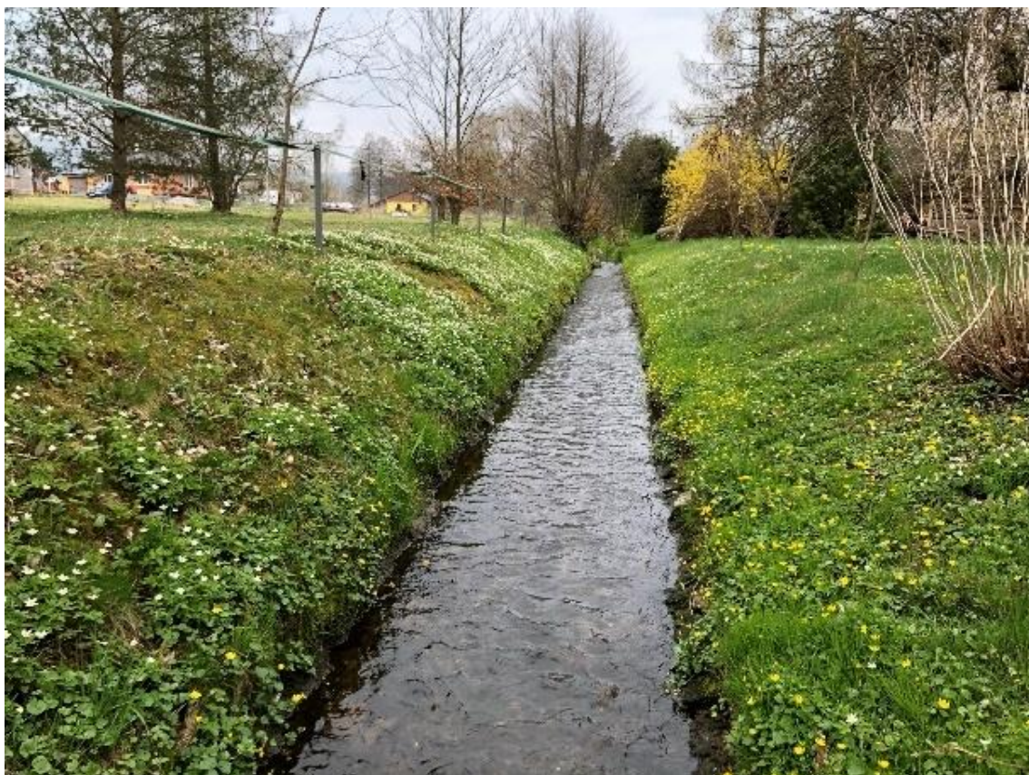
Obrázek 31 Pohled na koryto (ř.km 8.100 - proti proudu)