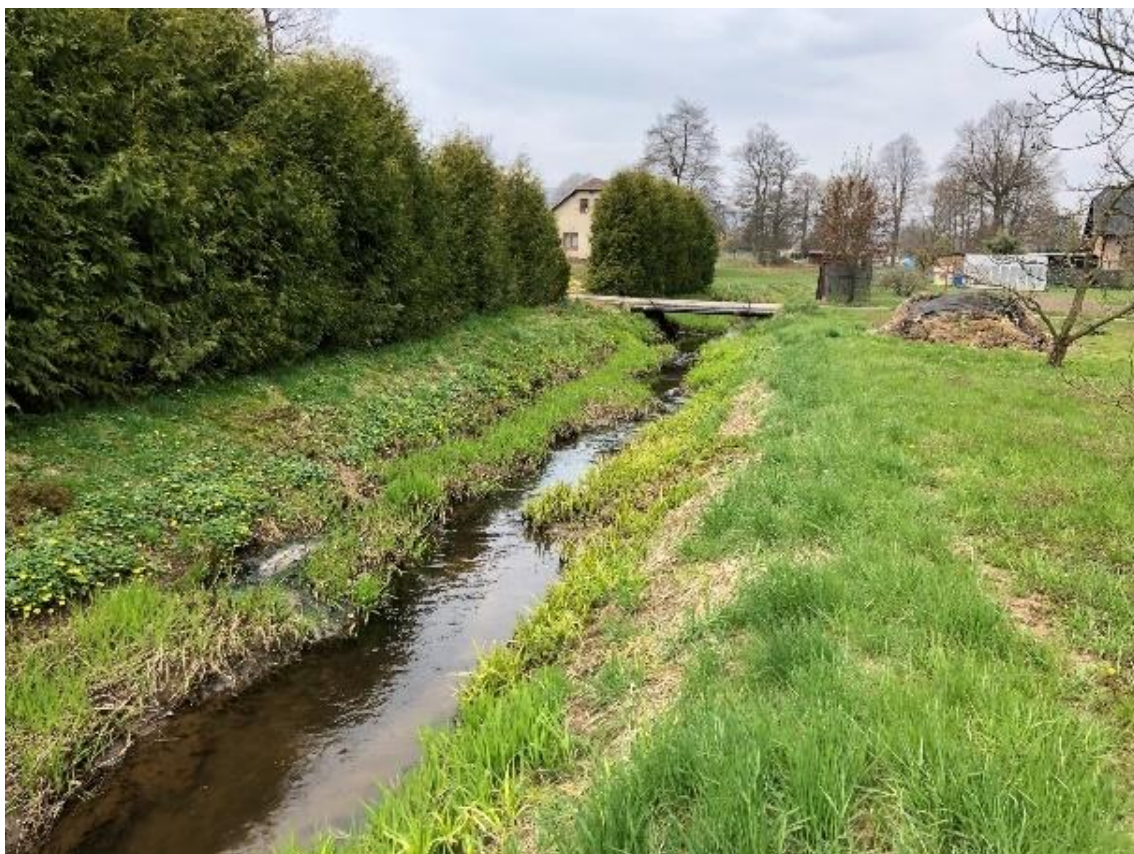
Obrázek 25 Pohled na vodní tok (ř.km 7.850 - proti proudu)