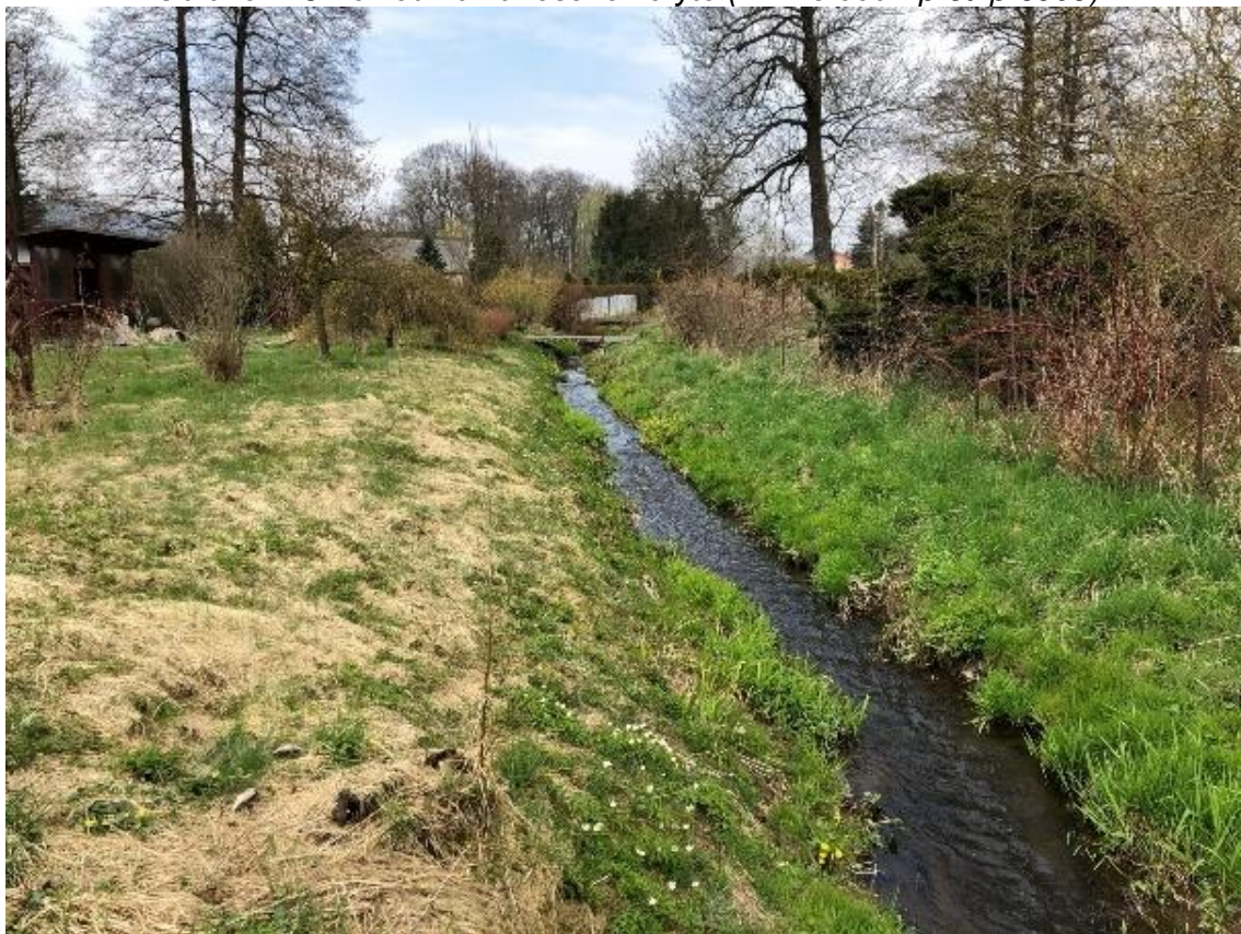
Obrázek 46 Pohled na zanesené koryto (ř.km 8.70 - proti proudu)