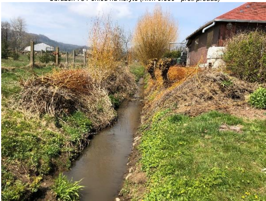
Obrázek 76 Pohled na koryto (ř.km 9.920 - proti proudu)