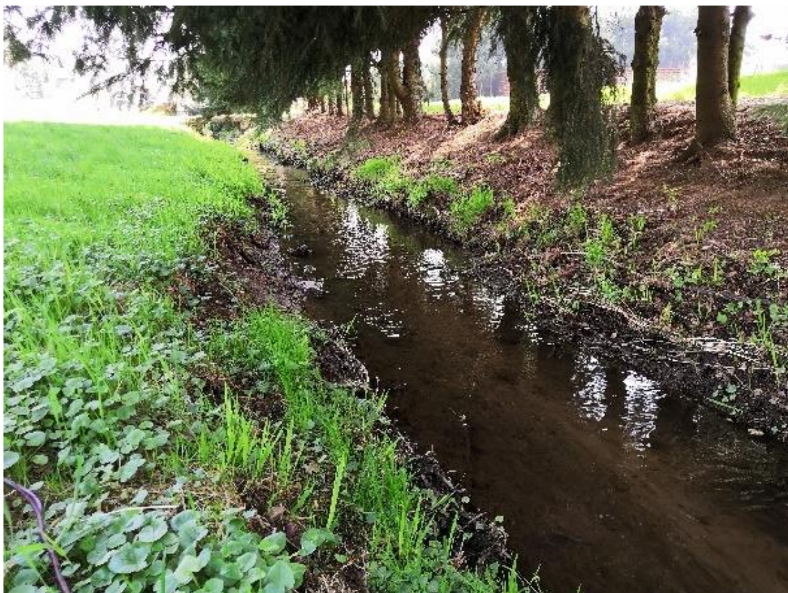
Obrázek 65 Pohled na koryto (ř.km 9.530 - po proudu)