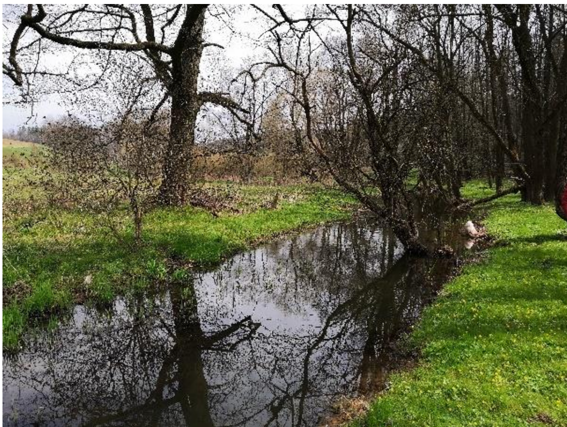
Obrázek 7 Pohled na koryto toku (ř.km 7.230 - po proudu)