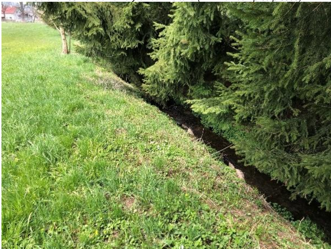
Obrázek 94 Pohled na koryto vodního toku (ř.km 10.800 - proti proudu)