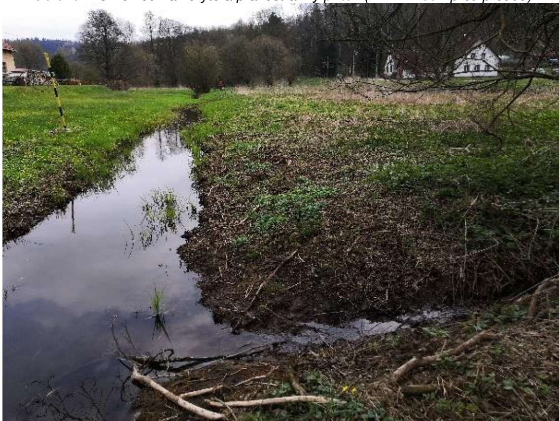
Obrázek 14 Pohled na koryto a pravostranný přítok (ř.km 7.430 - po proudu)