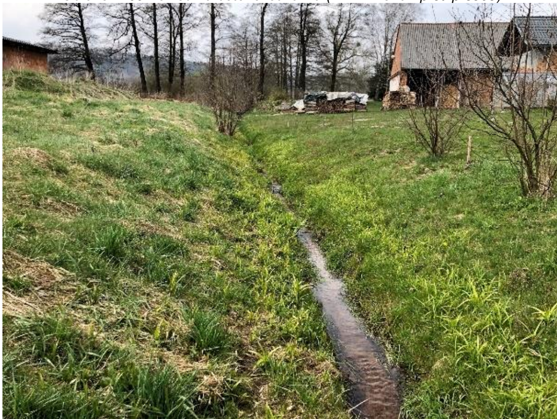
Obrázek 110 Pohled na vodní tok (ř.km 11.560 - proti proudu)