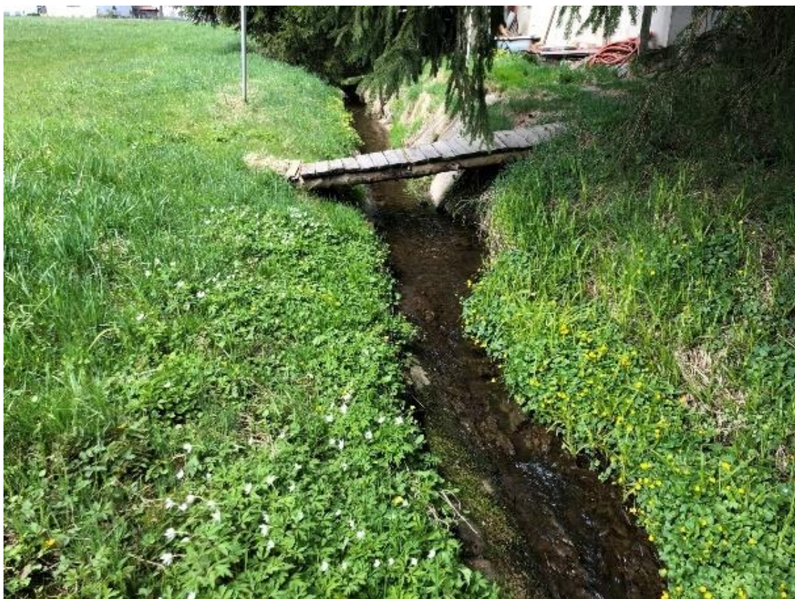
Obrázek 95 Pohled na dřevěnou lávku (ř.km 10.850 - proti proudu)