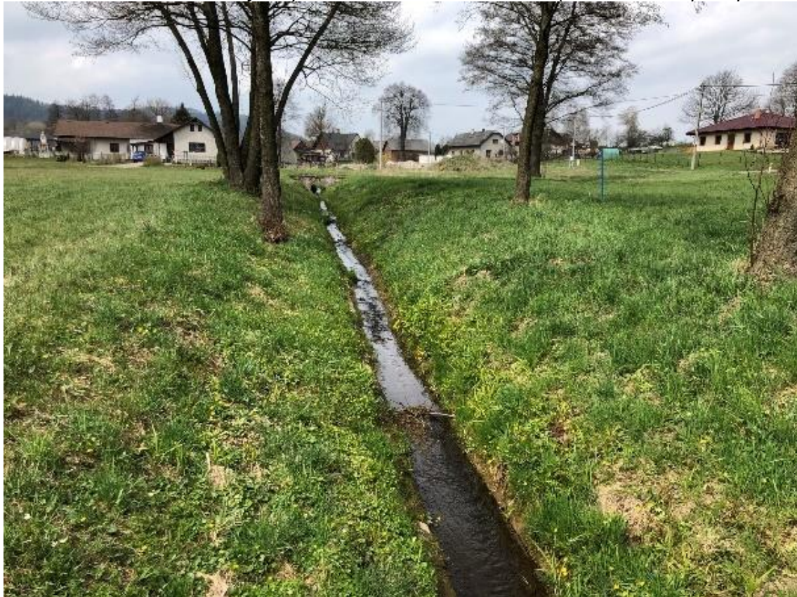
Obrázek 106 Pohled na koryto opevněné bet. žlabem ve dně (ř.km 11.400 - proti proudu)