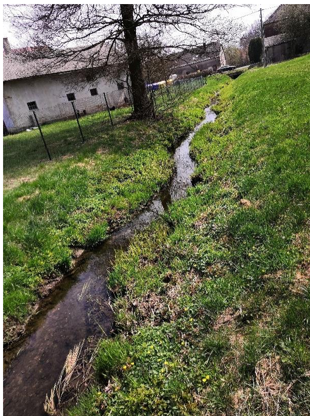
Obrázek 55 Pohled na zanesené koryto (ř.km 9.100 - po proude)