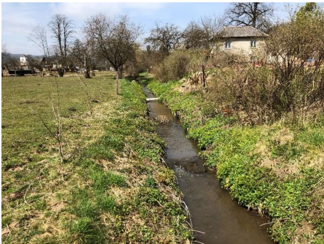
Obrázek 77 Pohled na koryto vodního toku (ř.km 9.950 - proti proudu)