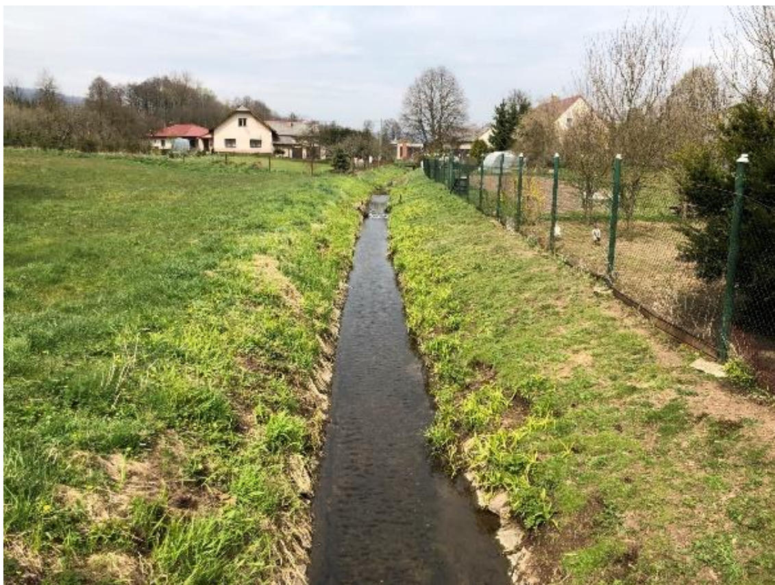
Obrázek 37 Pohled na přímý úsek koryta (ř.km 8.300 - proti proudu)