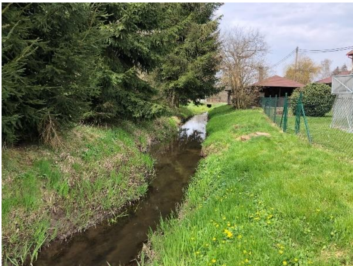
Obrázek 17 Pohled na koryto toku (ř.km 7.550 - proti proudu)