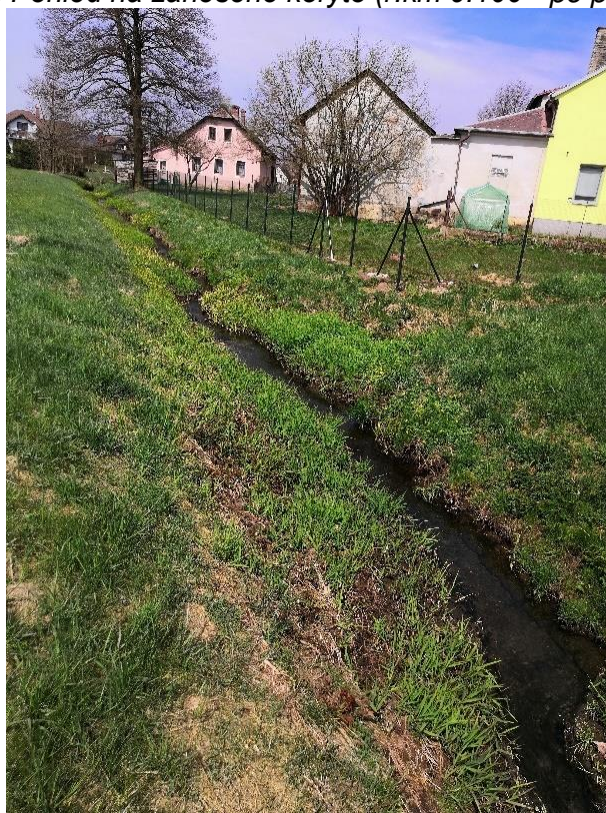
Obrázek 56 Pohled na zanesené koryto (ř.km 9.150 - proti proudu)