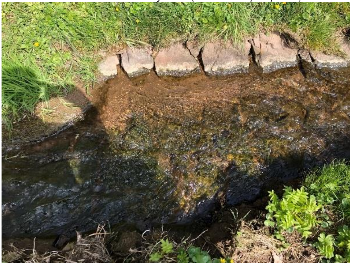
Obrázek 84 Detail stávajícího opevnění (ř.km 10.250 - po proude)