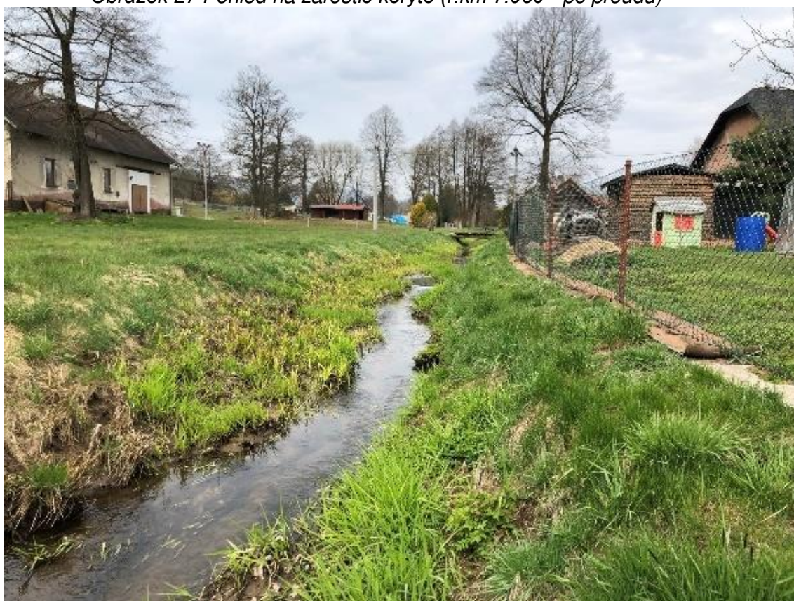
Obrázek 28 Pohled na zarostlé koryto (ř.km 7.950 - proti proudu)