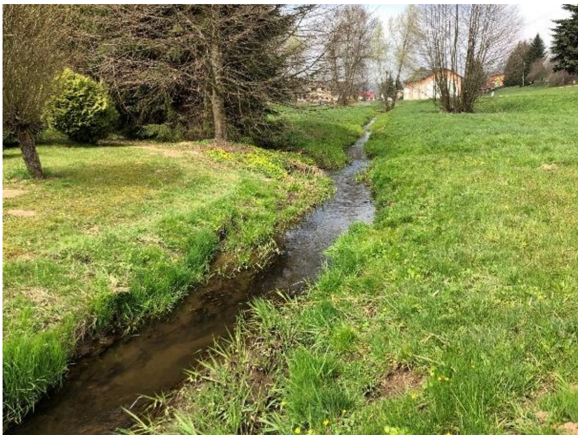
Obrázek 49 - Pohled na koryto s pravostranným přítokem (ř.km 8.835 - proti proudu)