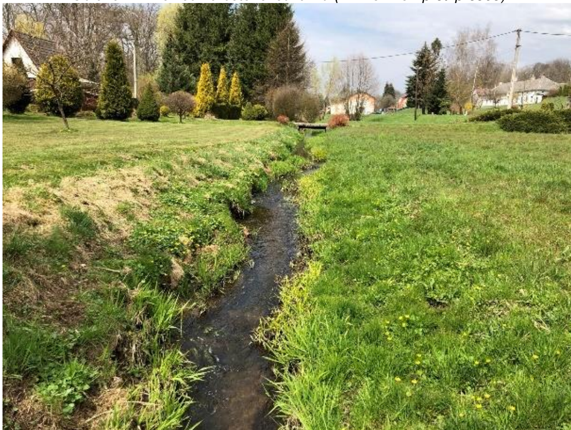
Obrázek 48 Pohled na zanesené koryto (ř.km 8.760 - proti proudu)