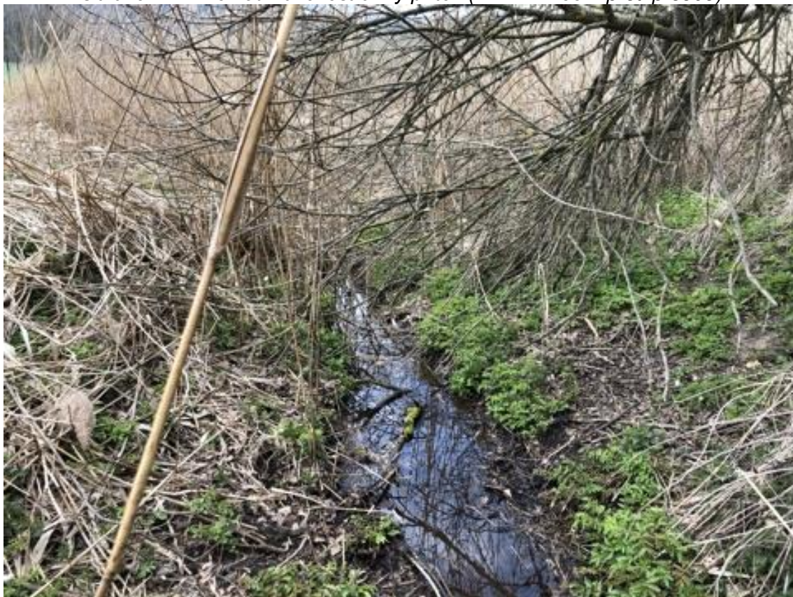
Obrázek 118 Pohled na zarostlé koryto toku (ř.km 11.750 - proti proudu)