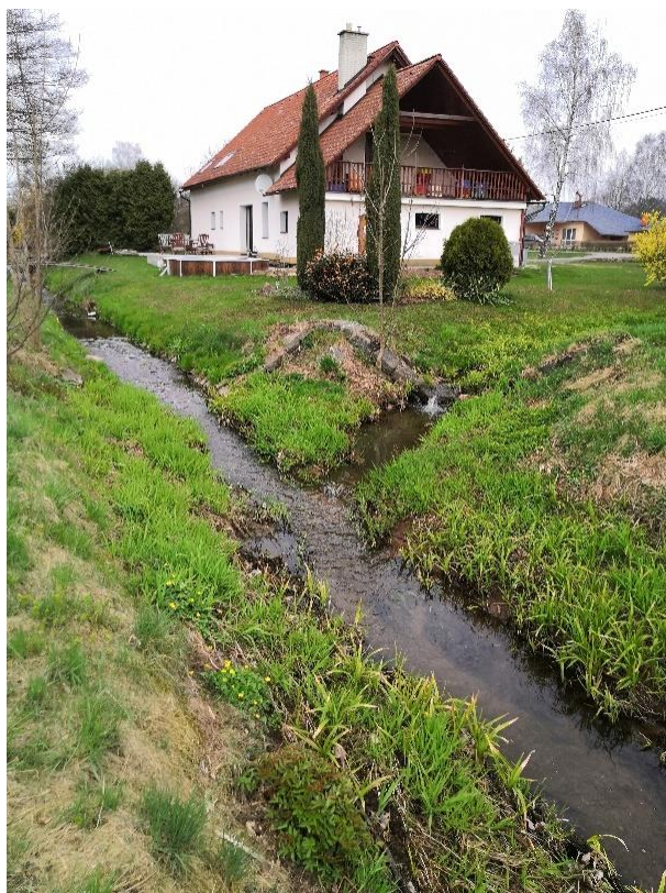
Obrázek 29 Pohled na levostranný přítok (ř.km 8.025 - proti proudu)