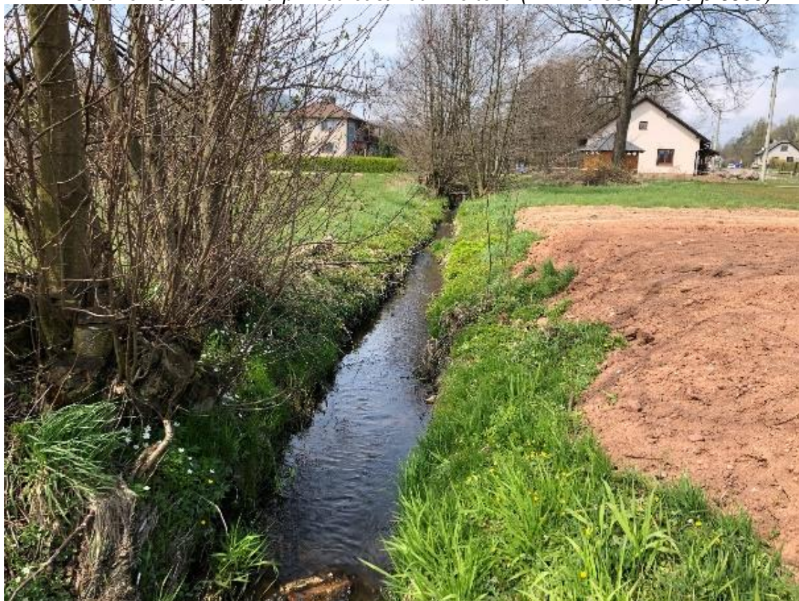
Obrázek 86 Pohled na koryto (ř.km 10.375 - proti proudu)