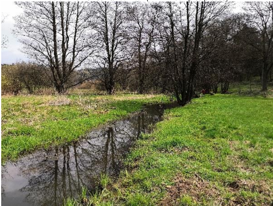
Obrázek 10 Pohled na vodní tok (ř. km 7.250 - po proudu)