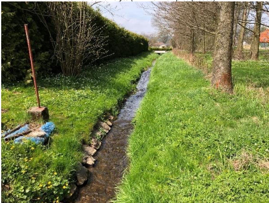
Obrázek 88 Pohled na koryto s viditelným opevněním (ř.km 10.490 - proti proudu)