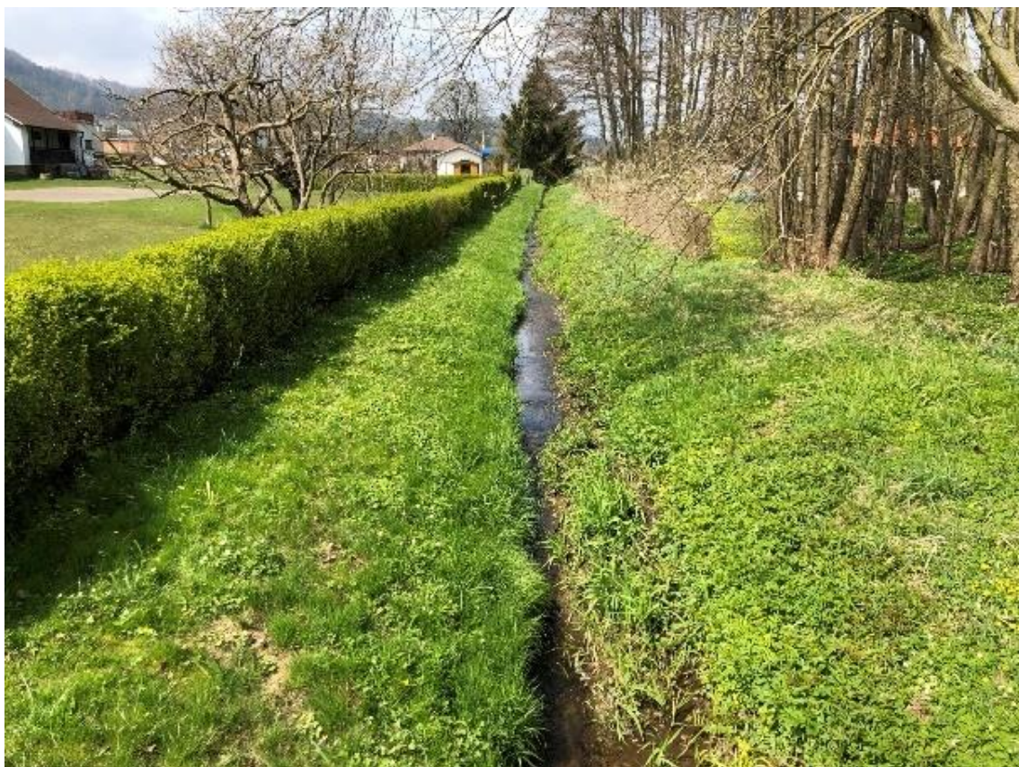
Obrázek 89 Pohled na přímou část toku (ř.km 10.530 - proti proudu)