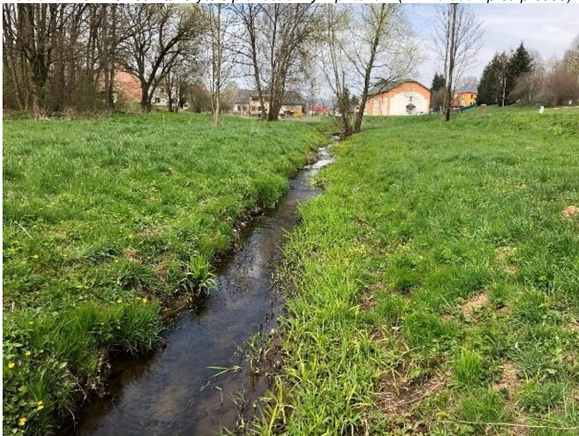
Obrázek 50 Pohled na přímý úsek koryta (ř.km 8.850 - proti proudu)