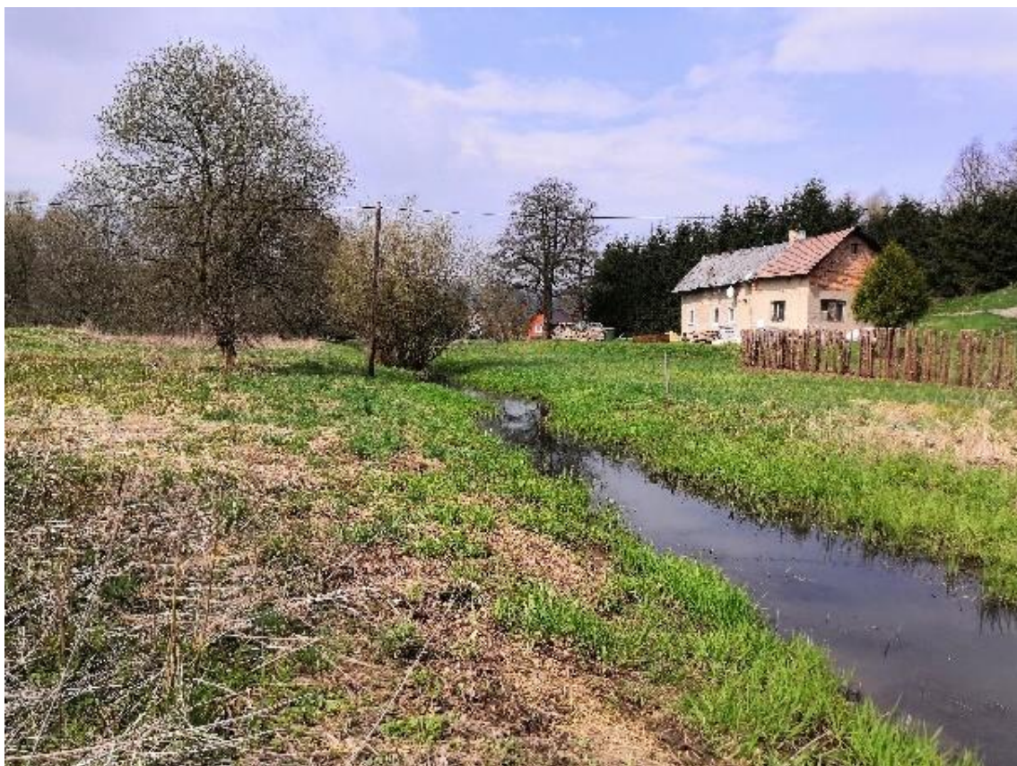
Obrázek 9 Pohled na vodní tok (ř.km 7.250 - proti proudu)