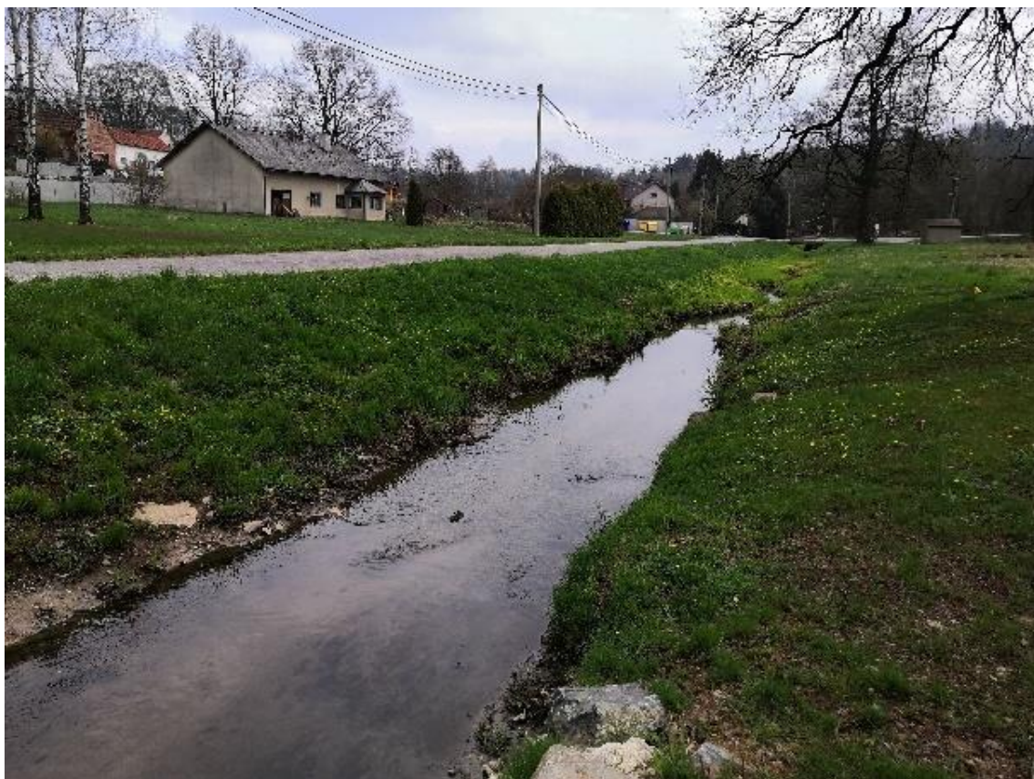
Obrázek 21 Pohled na koryto (ř.km 7.750 - po proudu)