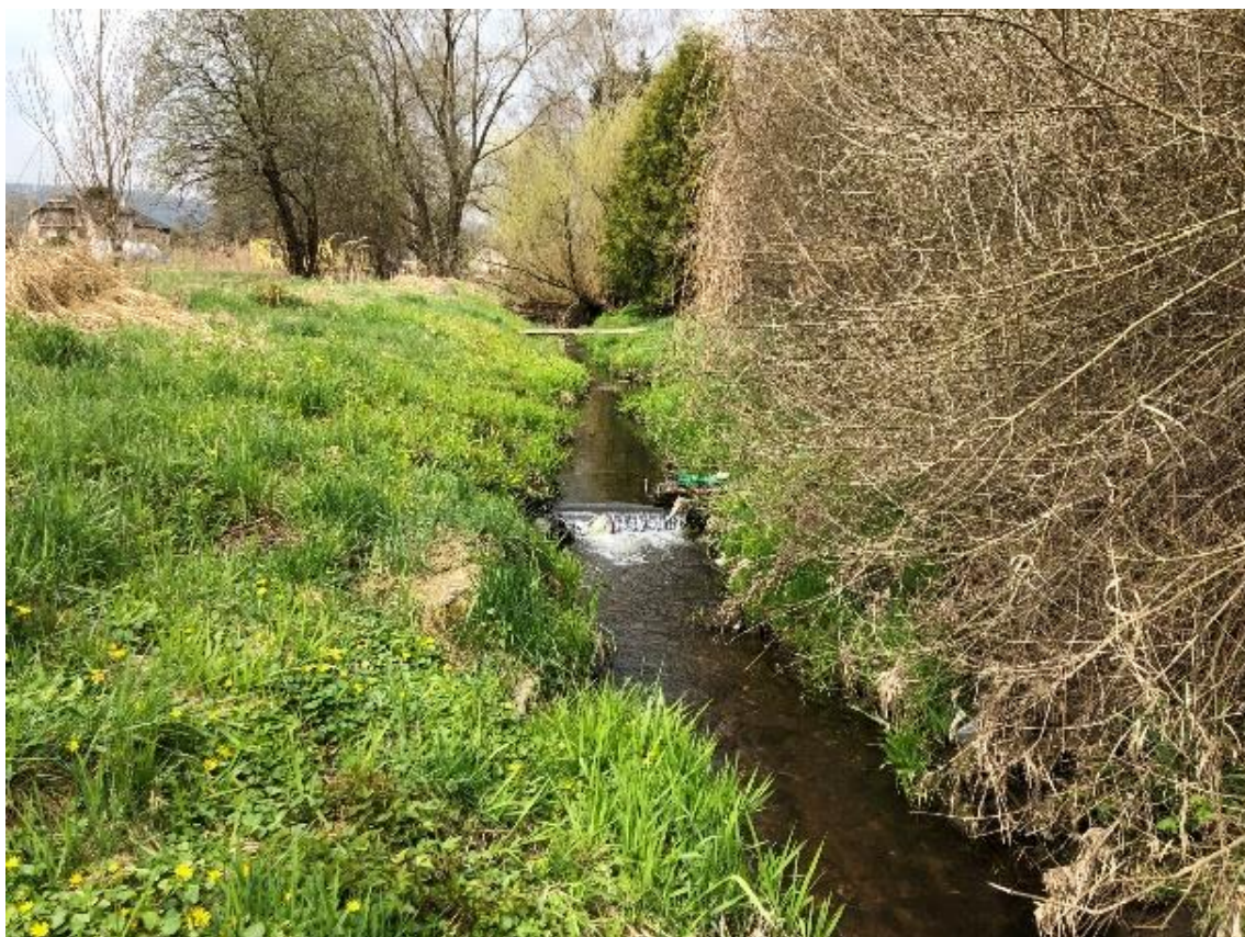
Obrázek 33 Pohled na neudržované koryto toku (ř.km 8.150 - proti proudu)