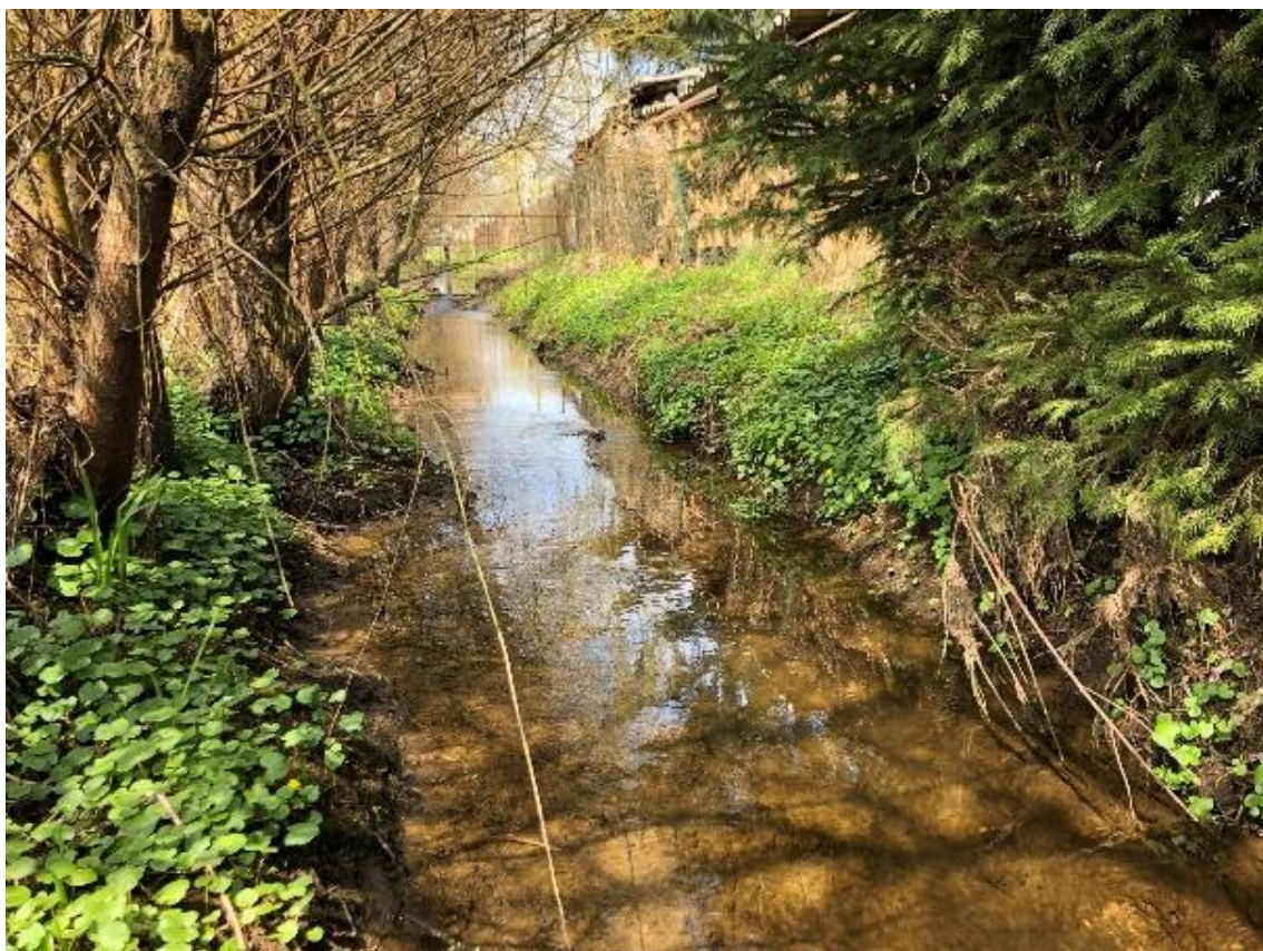
Obrázek 79 Pohled na koryto (ř.km 10.050 - proti proudu)