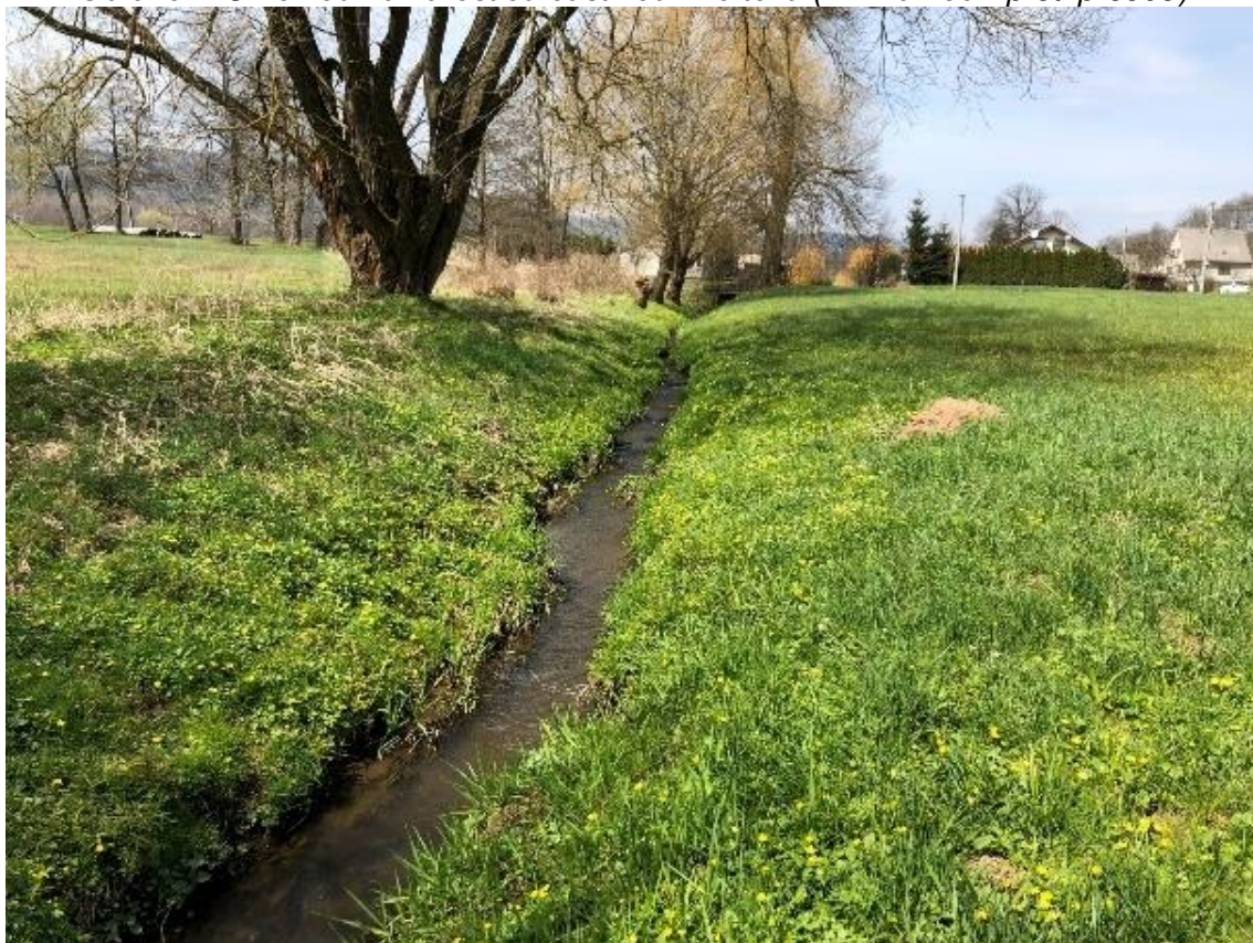
Obrázek 74 Pohled na koryto (ř.km 9.800 - proti proudu)