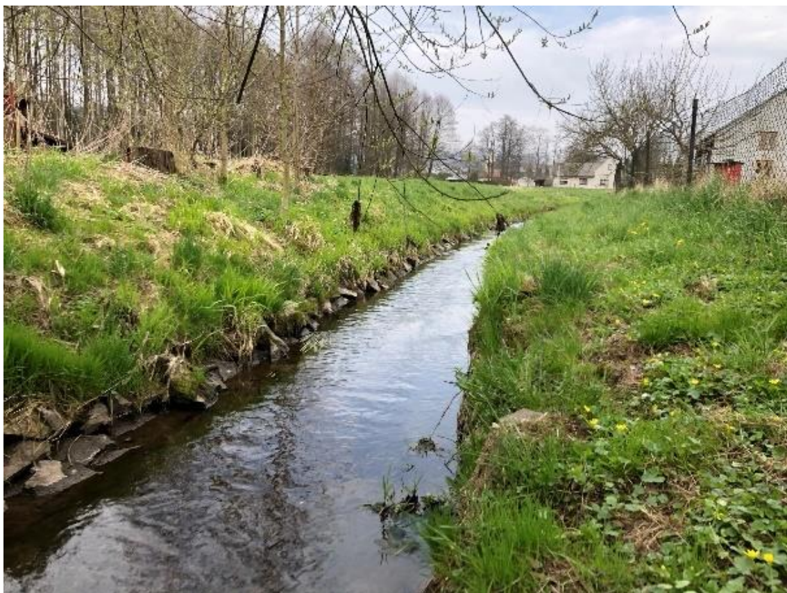
Obrázek 41 Pohled na koryto vodního toku (ř.km 8.500 - proti proudu)