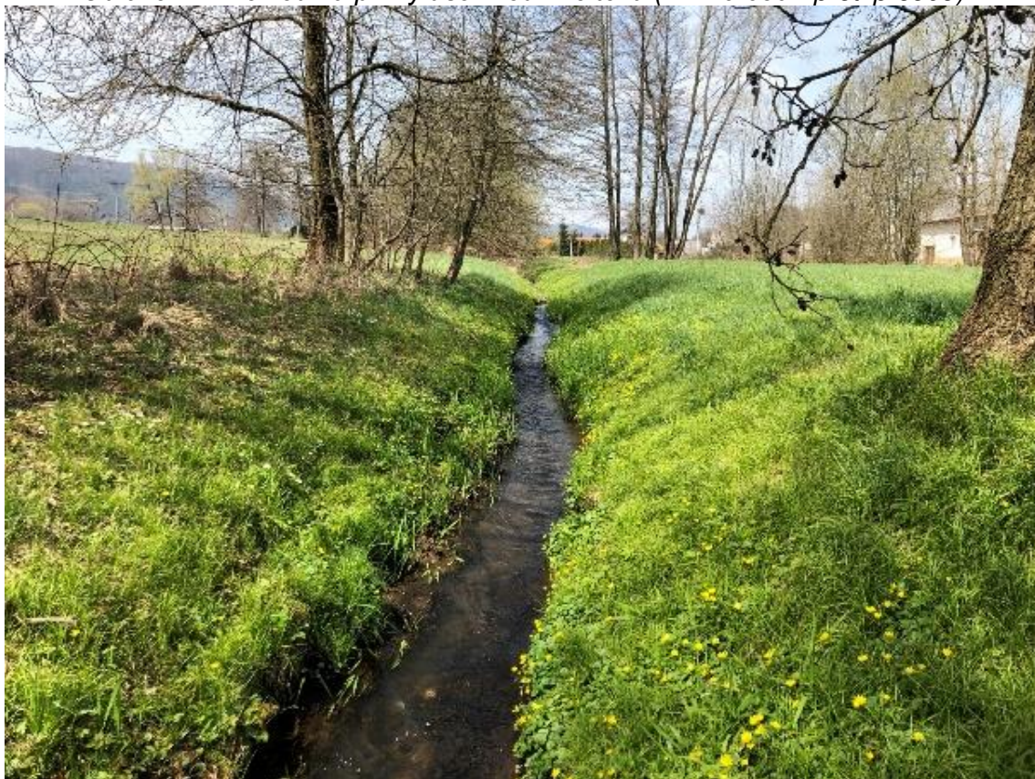
Obrázek 72 Pohled na vodní tok (ř.km 9.700 - proti proudu)