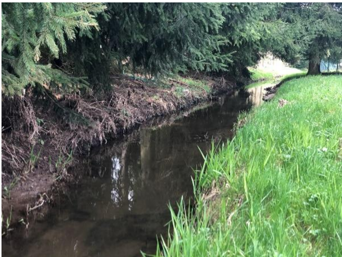
Obrázek 15 Pohled na vodní tok (ř.km 7.500 - proti proudu)