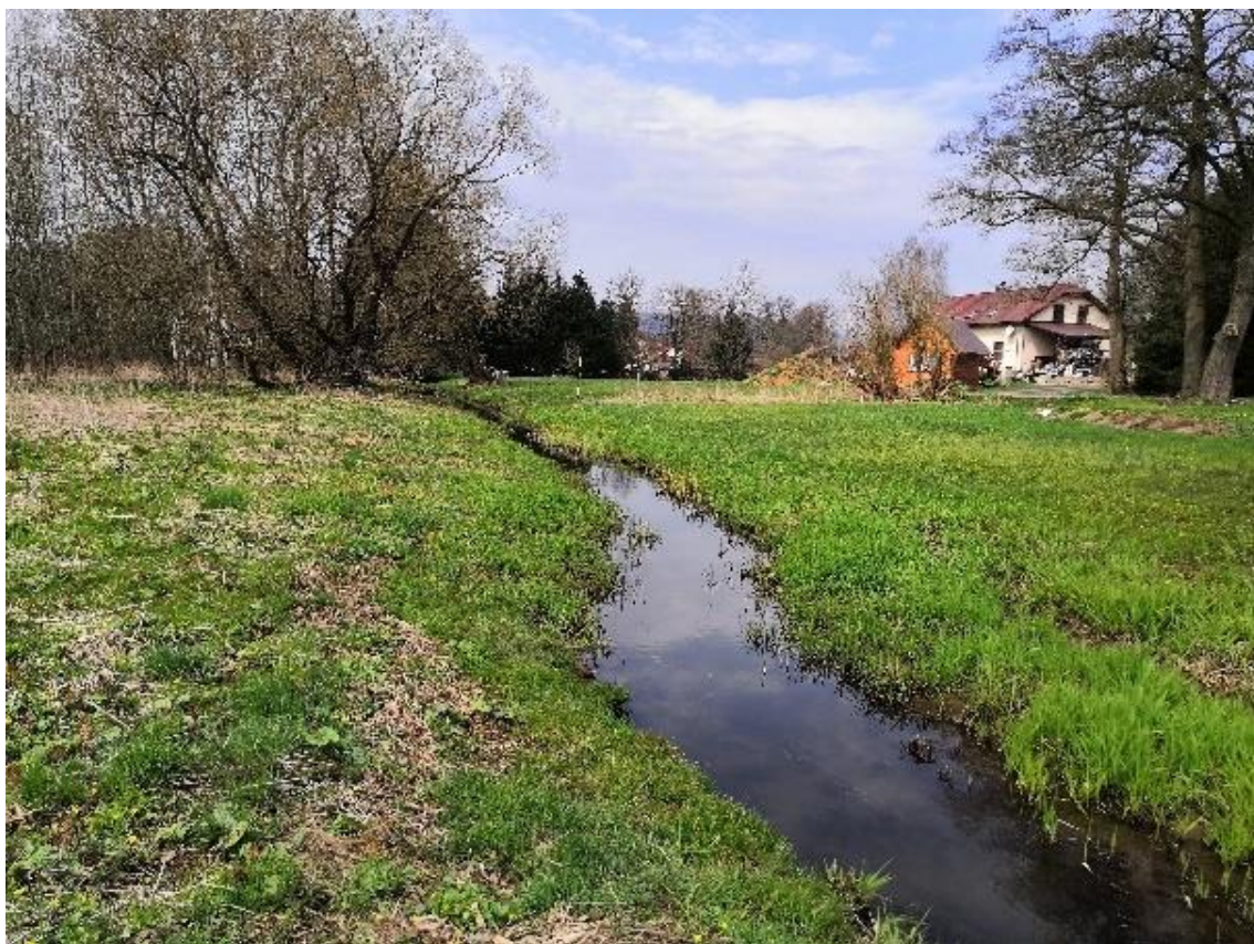
Obrázek 11 Pohled na zanesené koryto (ř.km 7.350 - proti proudu)