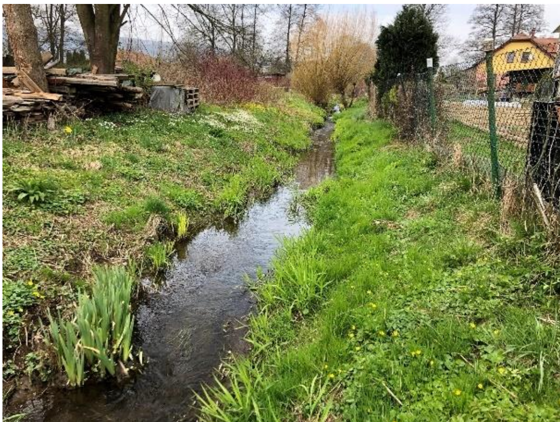
Obrázek 45 Pohled na zanesené koryto (ř.km 8.660 - proti proudu)