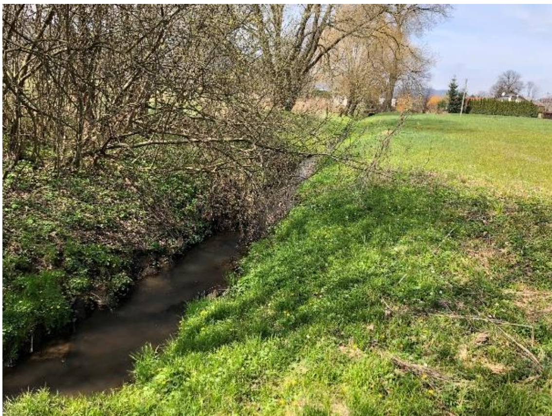
Obrázek 73 Pohled na zarostlou část vodního toku (ř.km 9.750 - proti proudu)