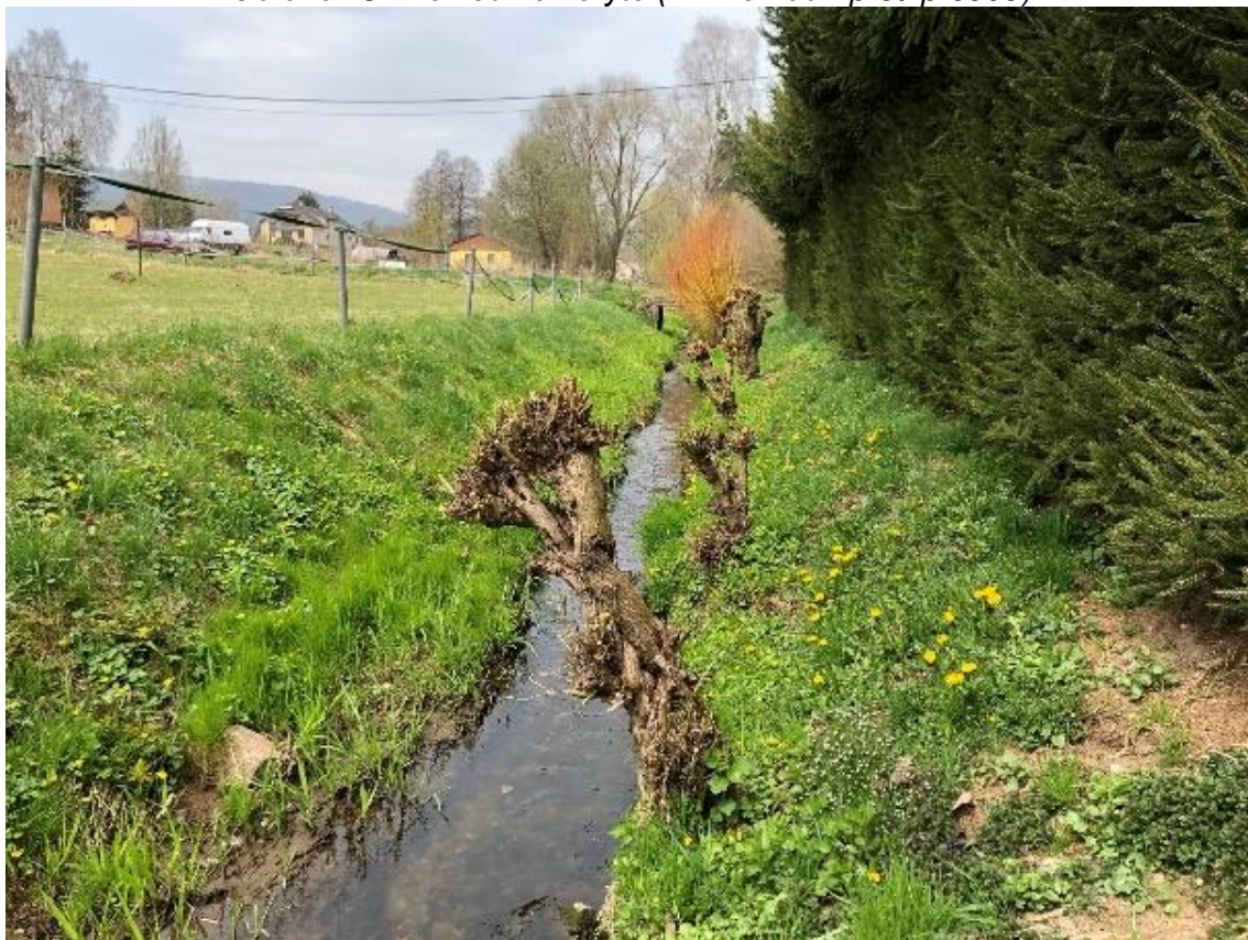
Obrázek 32 Pohled na koryto (ř.km 8.120 - proti proudu)