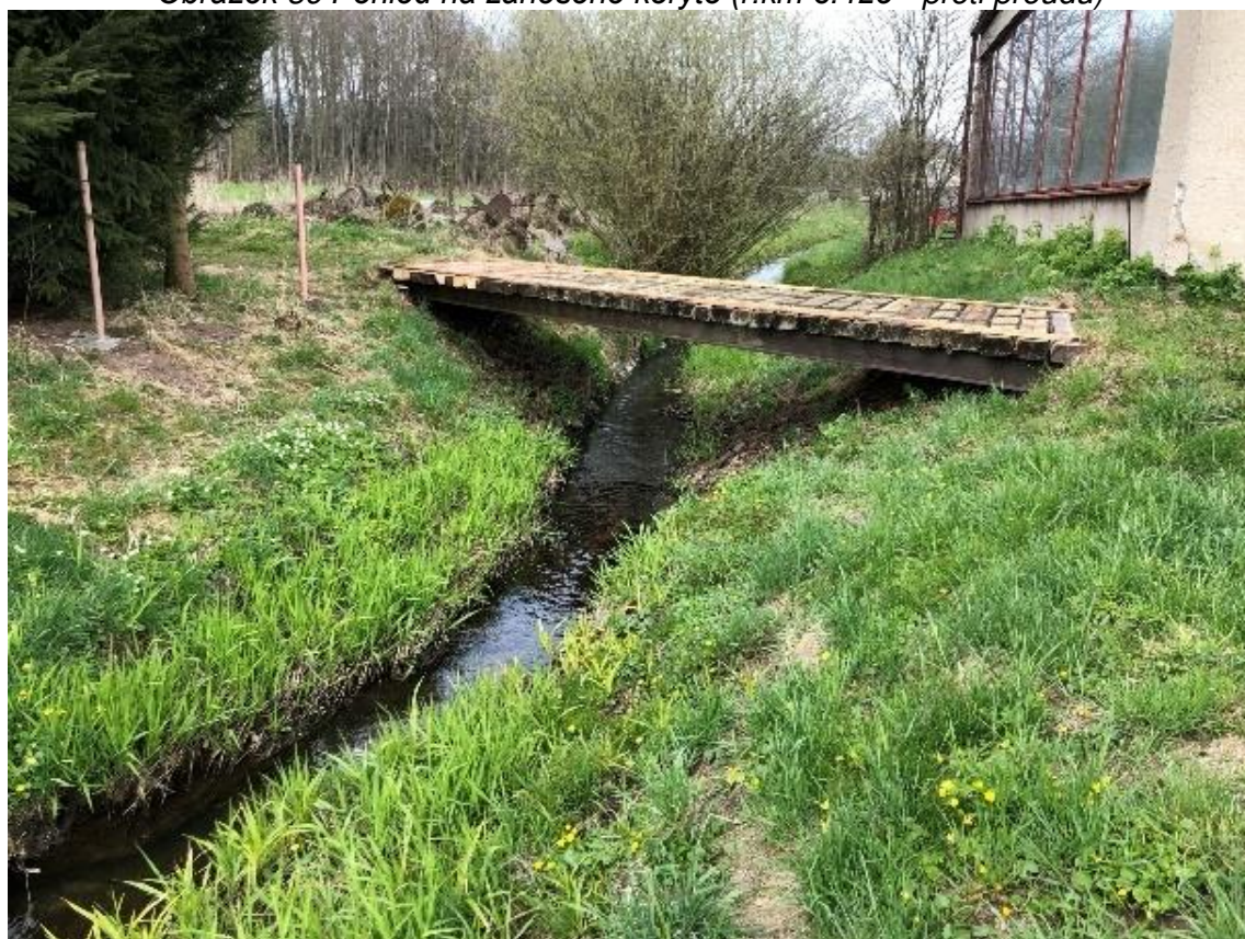
Obrázek 40 Pohled na dřevěnou lávku (ř.km 8.470 - proti proudu)