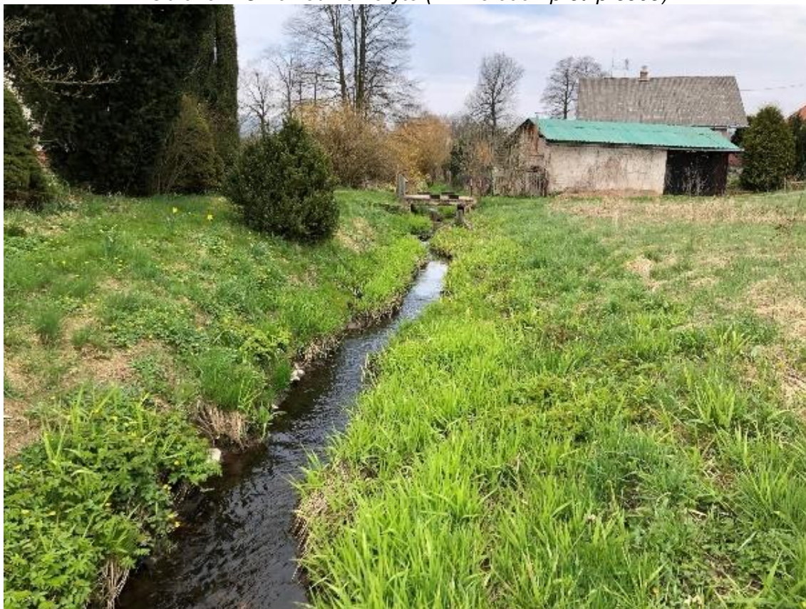
Obrázek 44 Pohled na koryto (ř.km 8.630 - proti proudu)