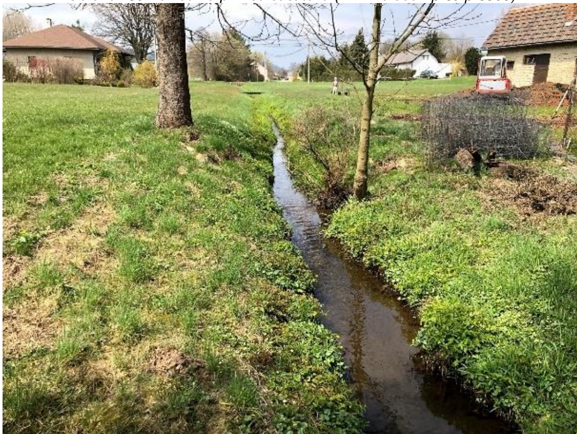
Obrázek 90 Pohled na přímou část toku (ř.km 10.600 - proti proudu)