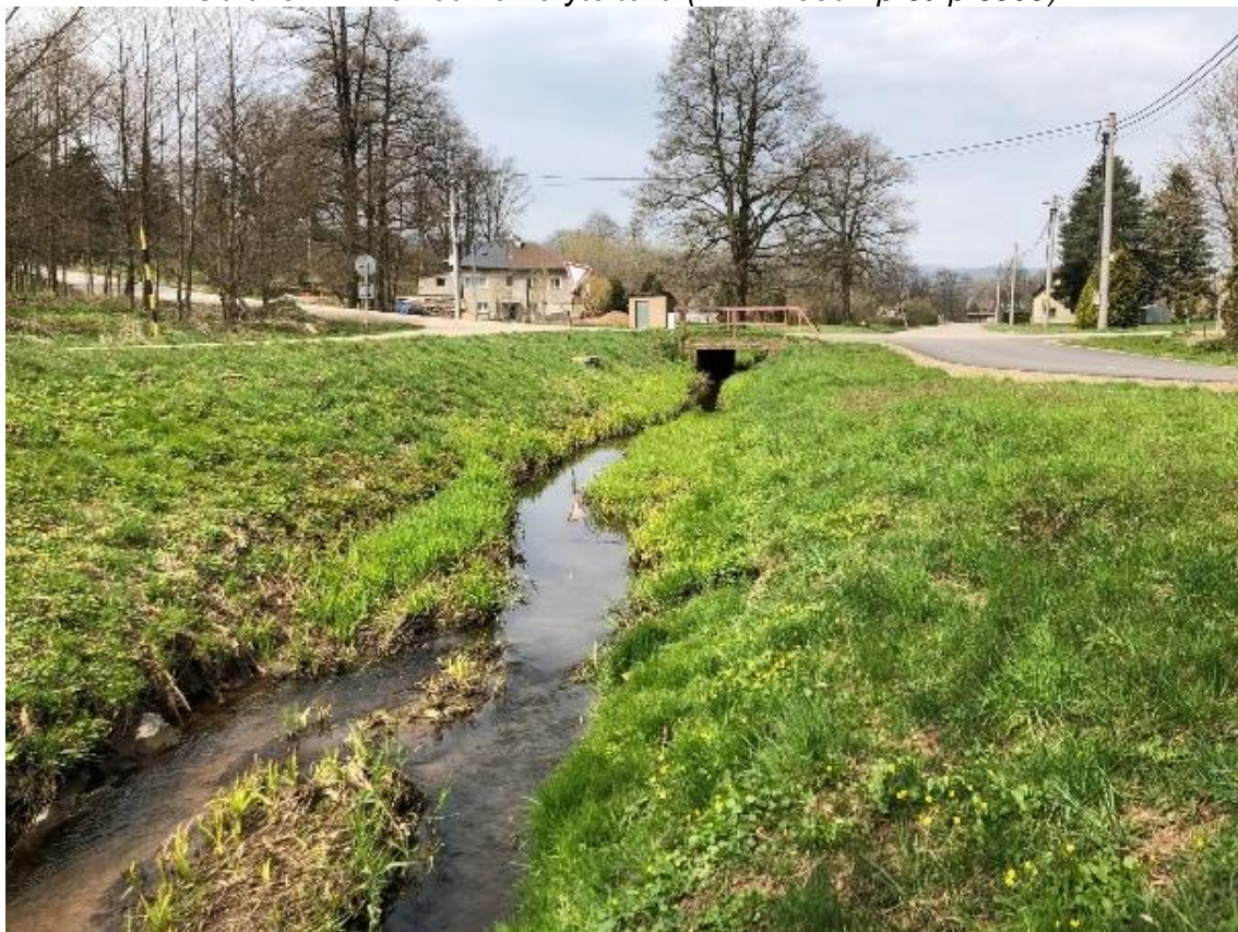
Obrázek 18 Pohled na koryto toku (ř.km 7.640 - proti proudu)