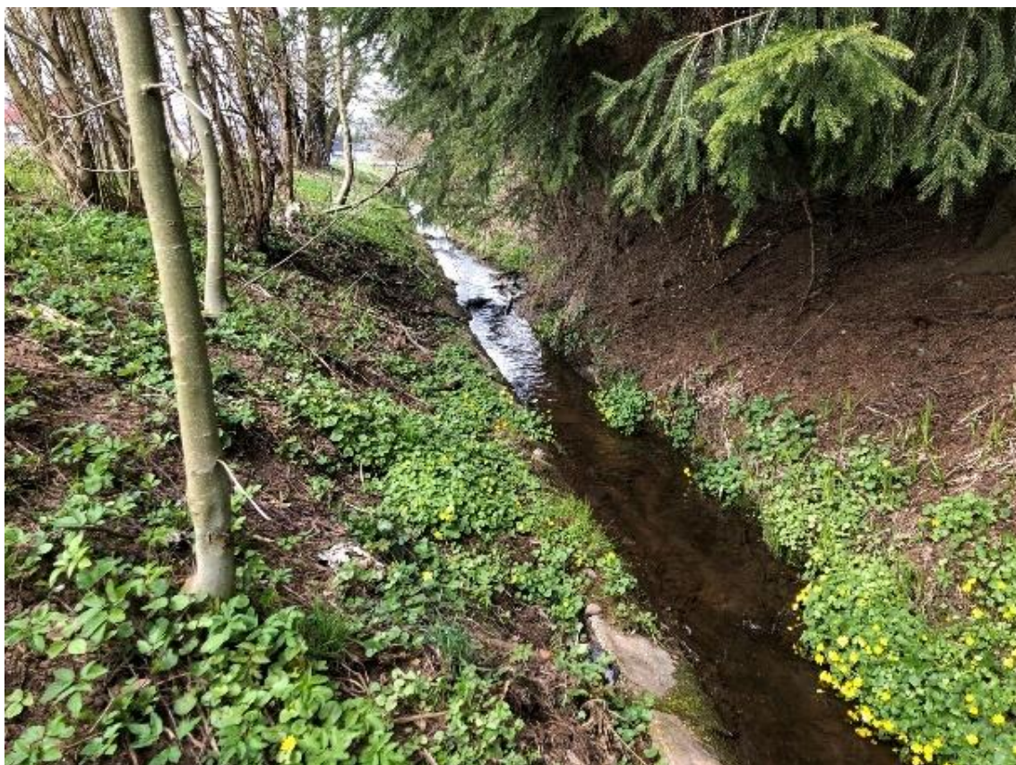
Obrázek 97 Pohled na koryto toku (ř.km 10.900 - proti proudu)