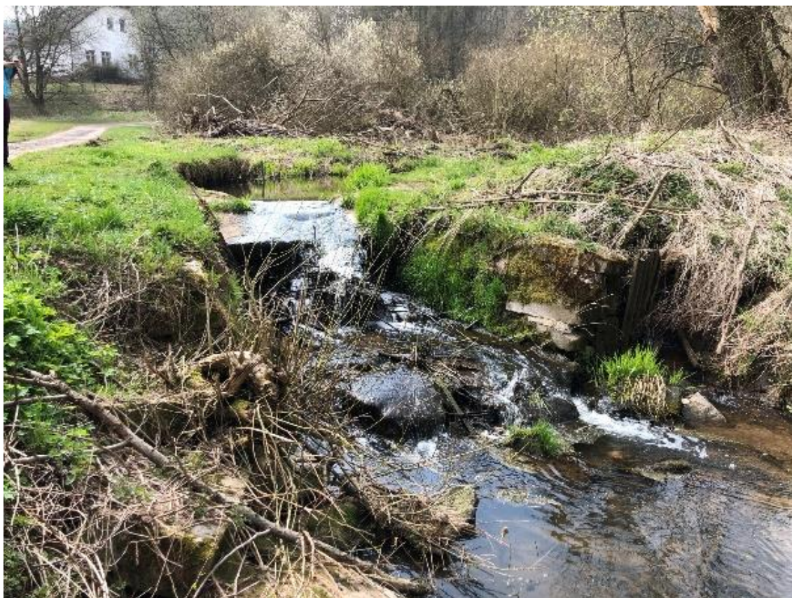
Obrázek 1 Pohled na začátek úseku (ř.km 7.090)