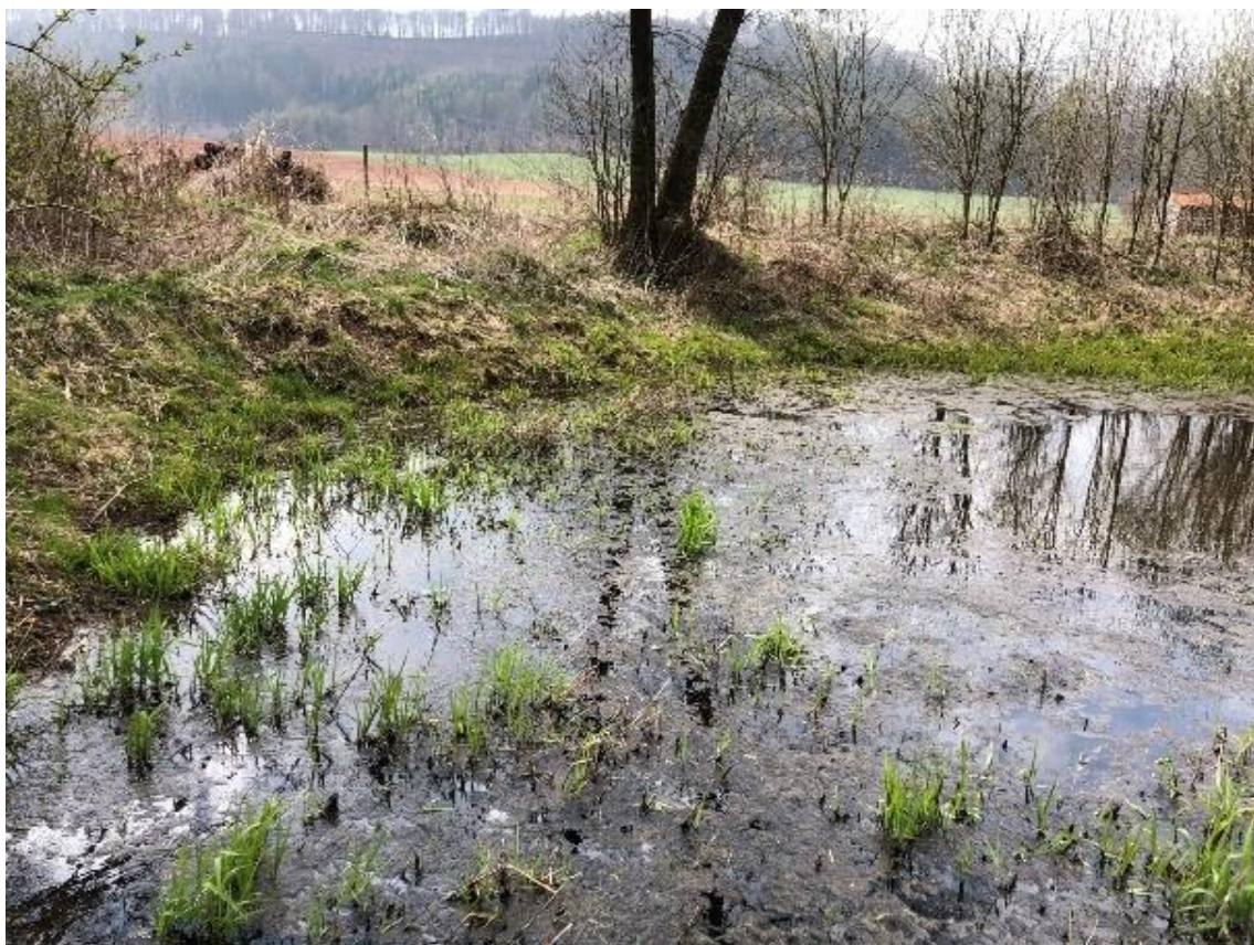
Obrázek 111 Pohled na vodní plochu na koncovém úseku (ř.km 11.630 - proti proudu)