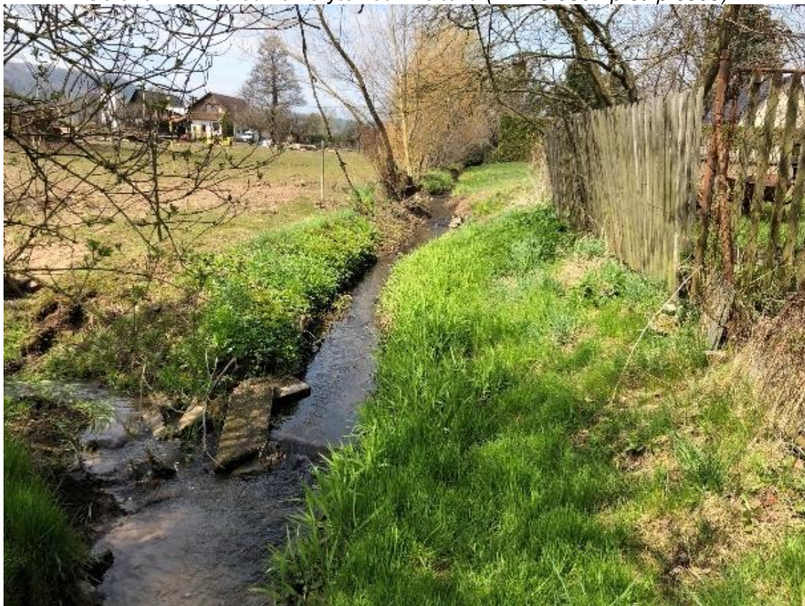
Obrázek 78 Pohled na pravostranný přítok (ř.km 10.015 - proti proudu)