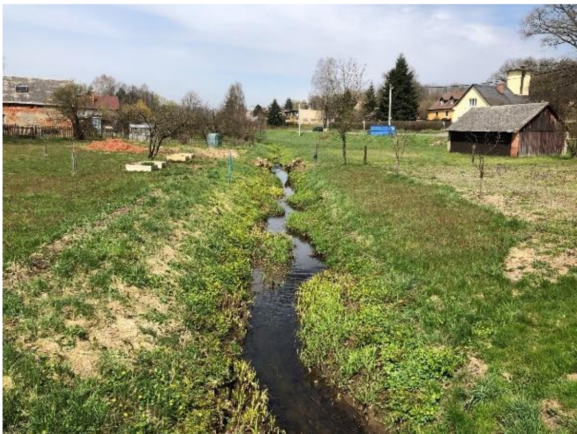
Obrázek 59 Pohled na koryto zaneseného toku (ř.km 9.275 - proti proudu)