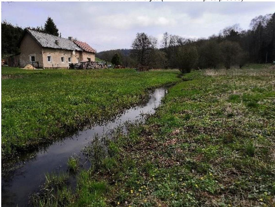
Obrázek 12 Pohled na zanesené koryto (ř.km 7.430 - po proudu)