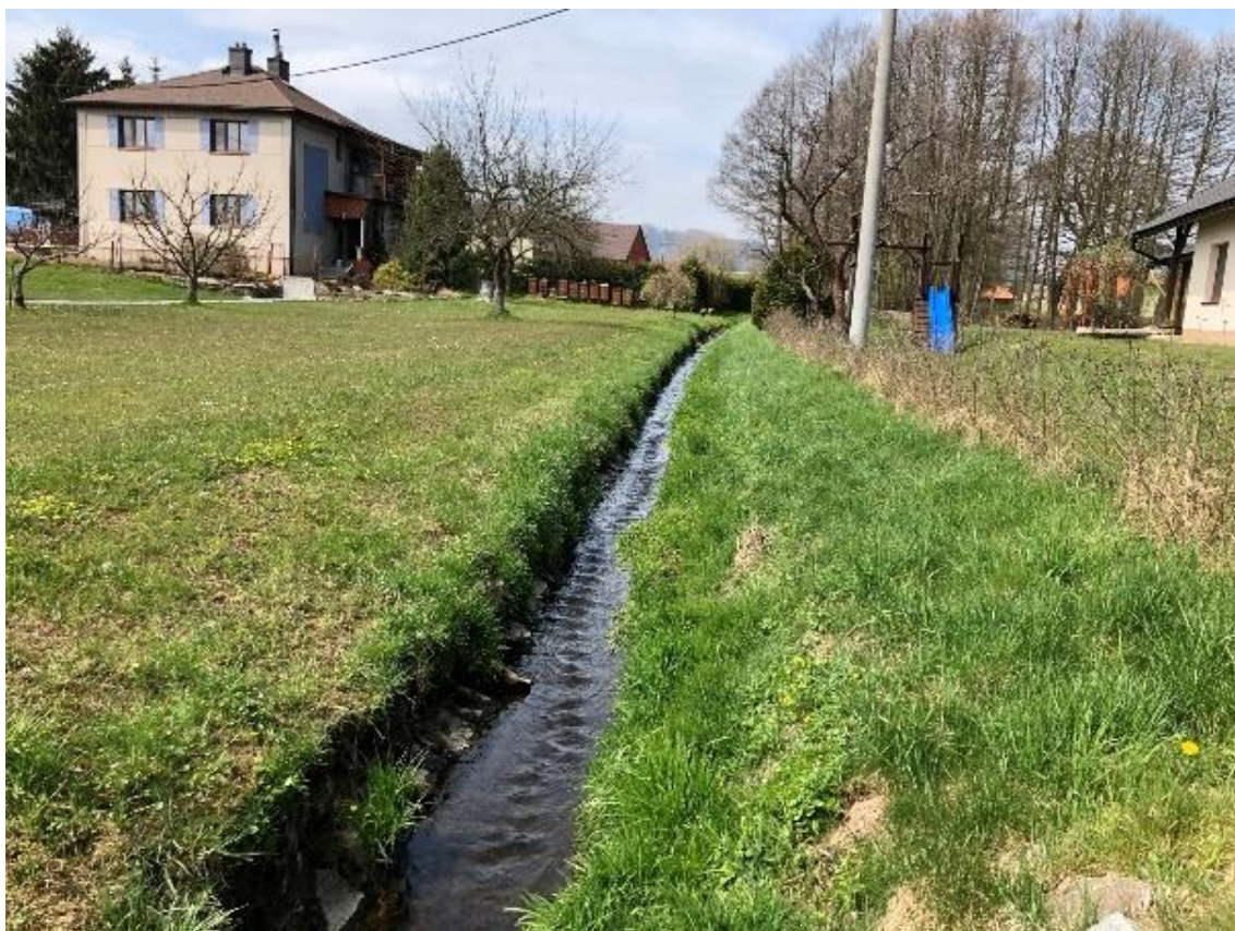
Obrázek 87 Pohled na koryto (ř.km 10.420 - proti proudu)