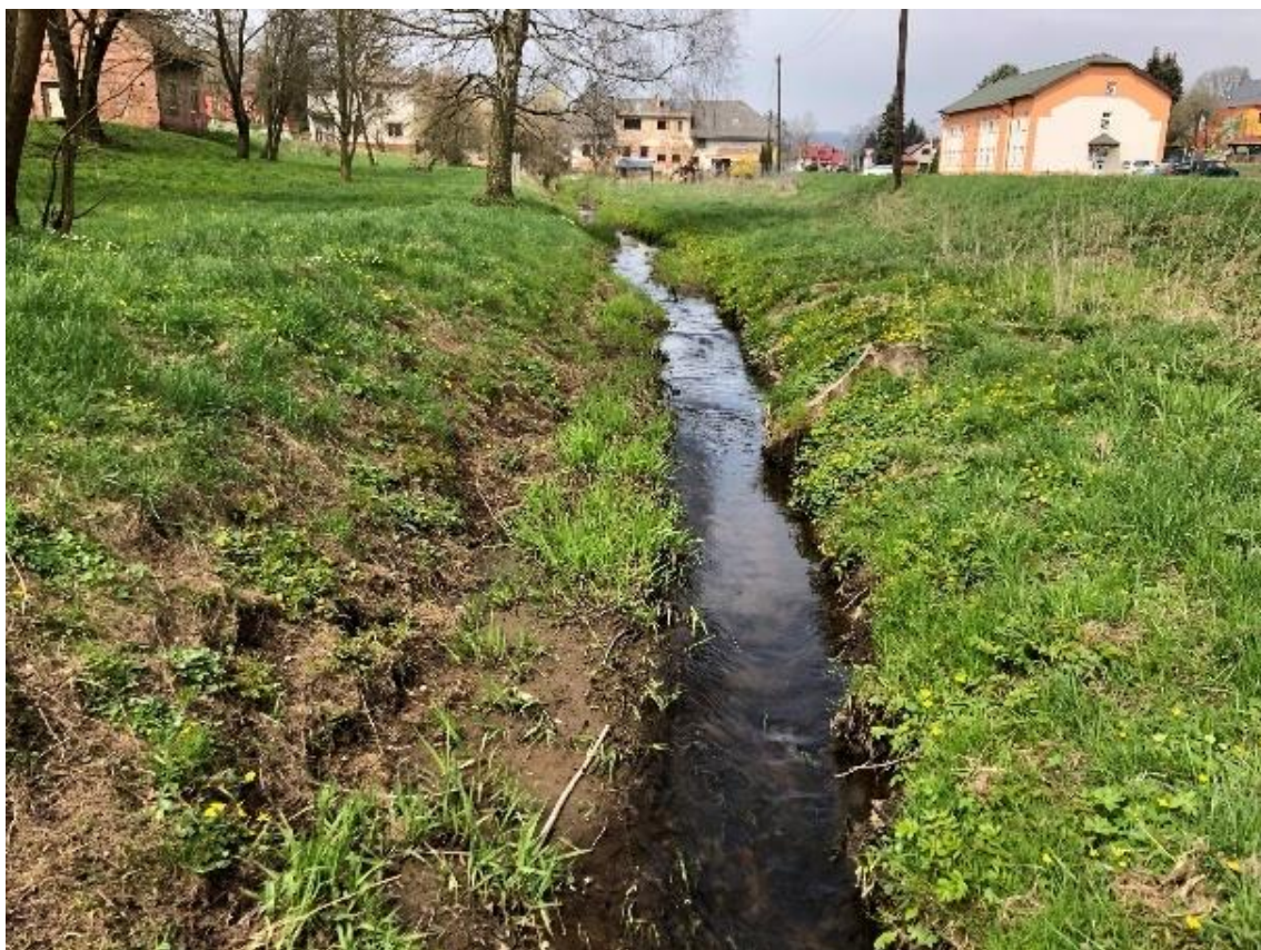
Obrázek 51 Pohled na koryto (ř.km 8.900 - proti proudu)