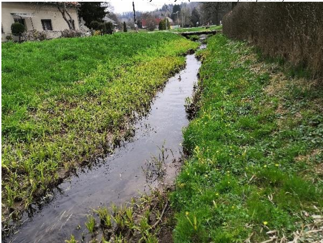
Obrázek 24 Pohled na zanesené koryto (ř.km 7.850 - po proudu)