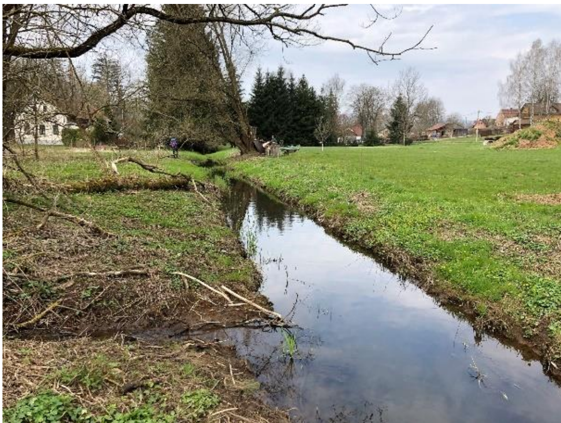
Obrázek 13 Pohled na koryto a pravostranný přítok (ř.km 7.430 - proti proudu)