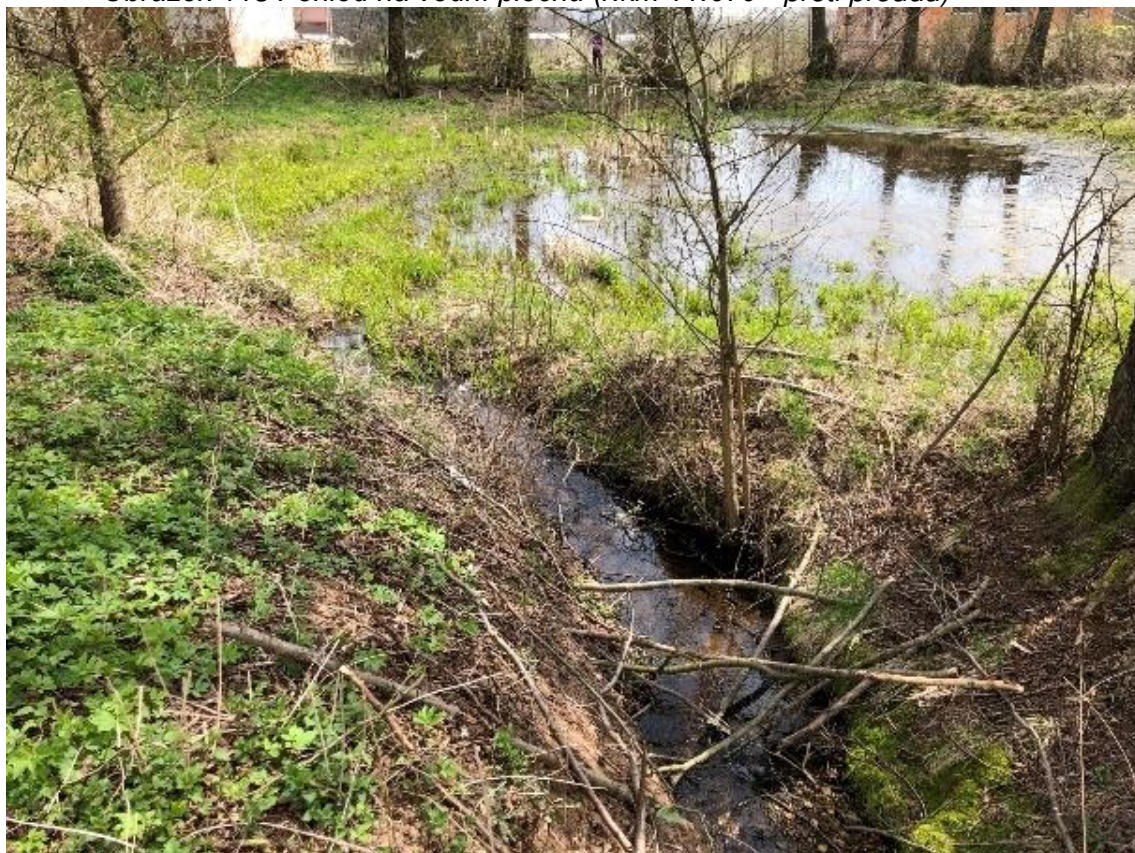
Obrázek 114 Pohled na přítok do vodní plochy (ř.km 11.690 - po proudu)