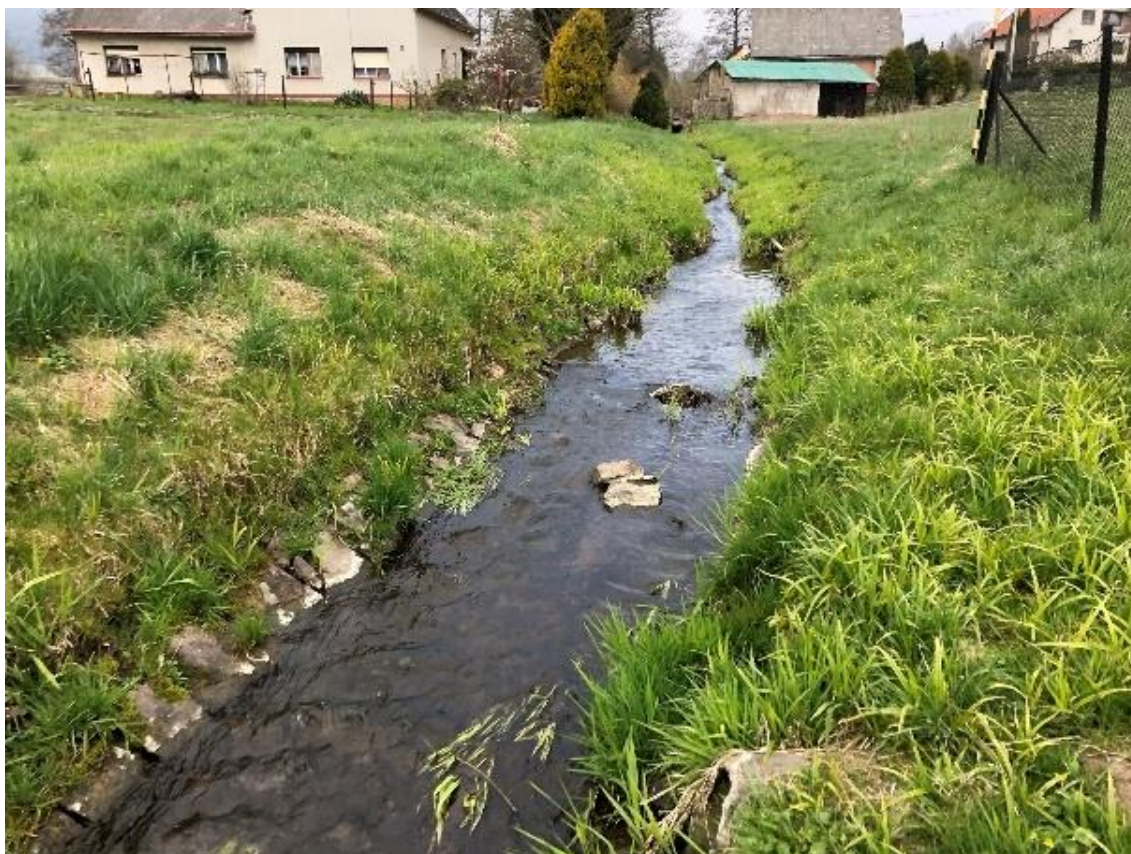
Obrázek 43 Pohled na koryto (ř.km 8.600 - proti proudu)