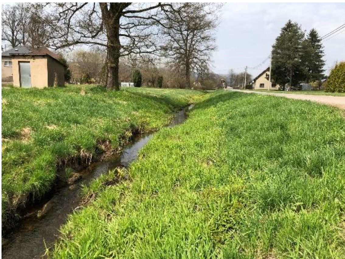
Obrázek 19 Pohled na zanesené koryto (ř.km 7.700 - proti proudu)