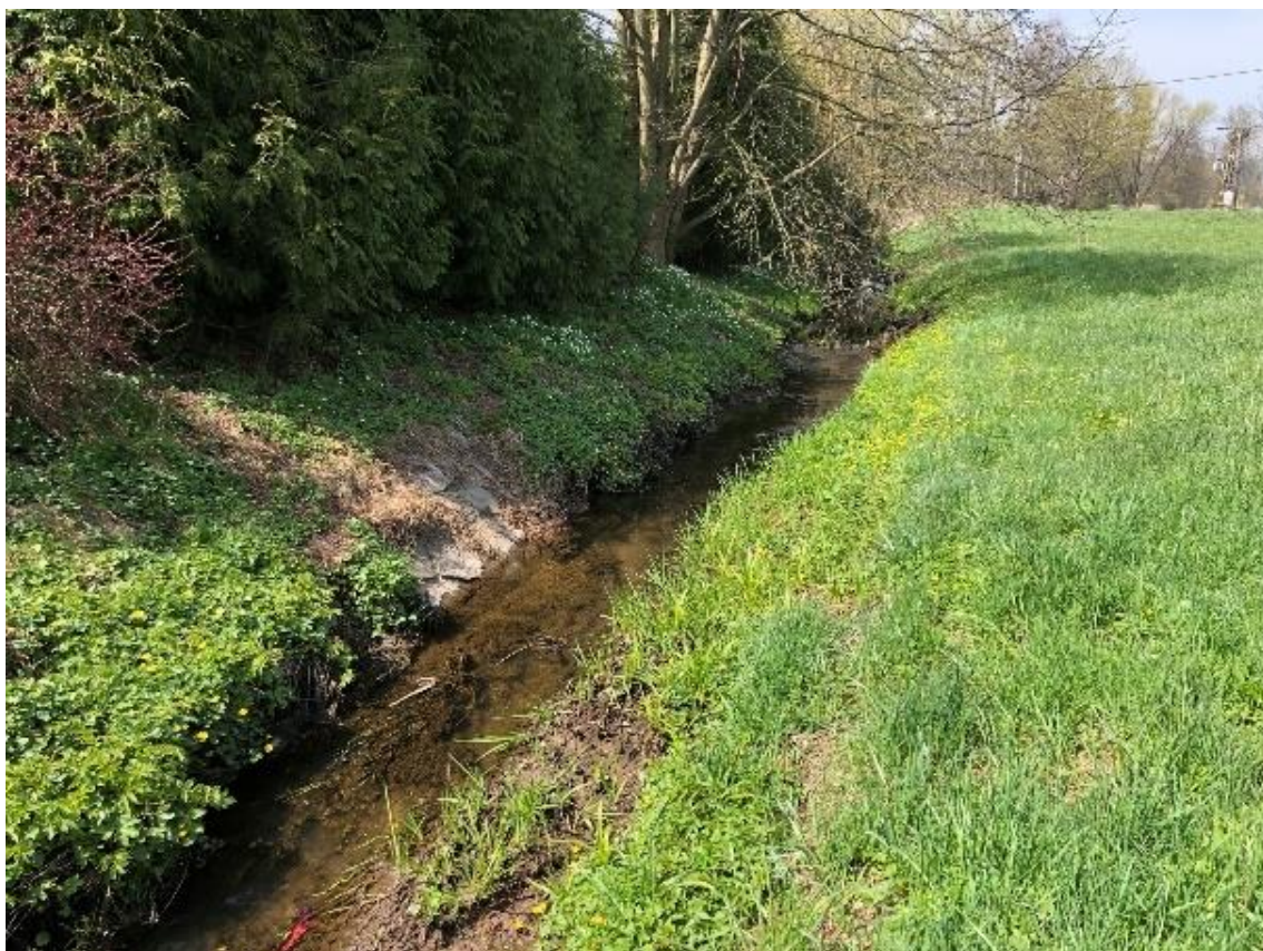
Obrázek 61 Pohled na koryto toku (ř.km 9.350 - proti proudu)