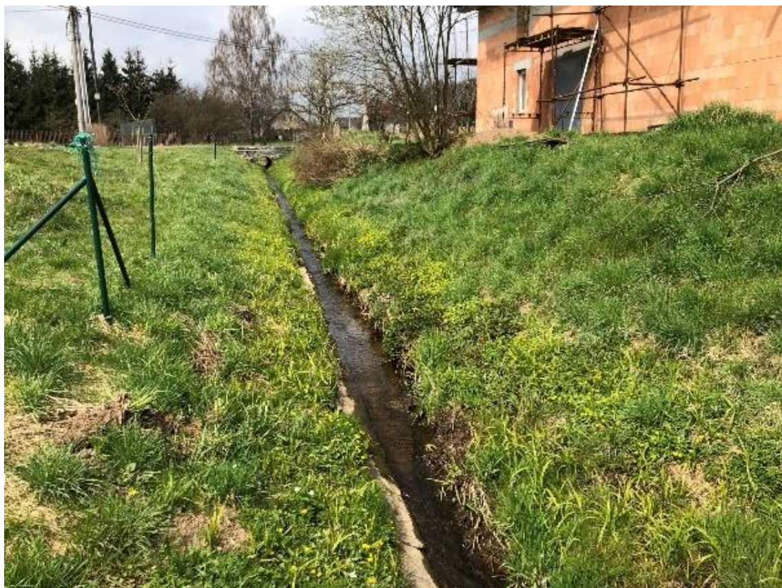
Obrázek 101 Pohled na přímou část toku (ř.km 11.050 - proti proudu)