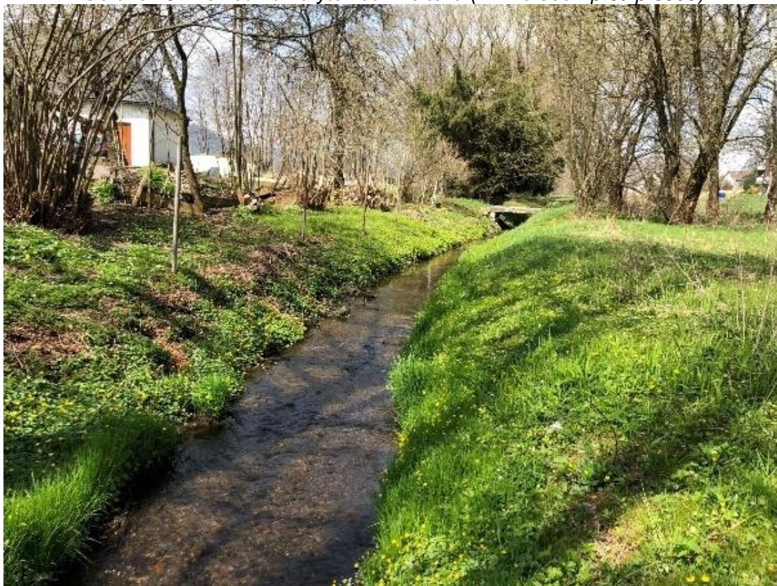
Obrázek 68 Pohled na koryto vodního toku (ř.km 9.600 - proti proudu)