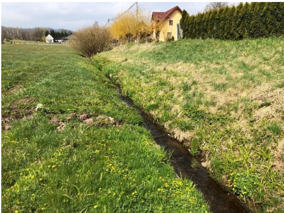
Obrázek 99 Pohled na přímou část vodního toku (ř.km 10.950 - proti proudu)