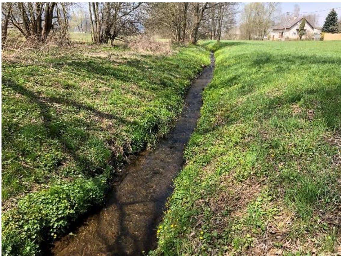
Obrázek 71 Pohled na přímý úsek vodního toku (ř.km 9.650 - proti proudu)