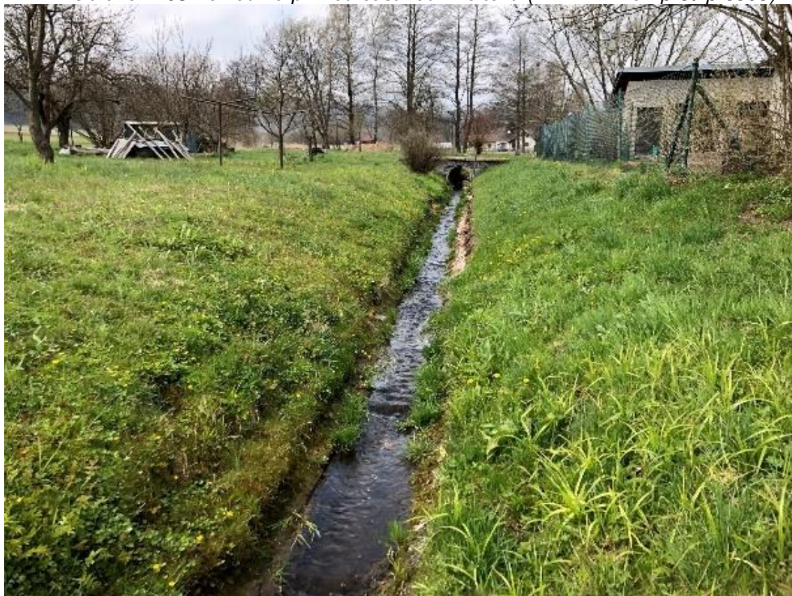
Obrázek 104 Pohled na koryto z bet. propustkem v pozadí (ř.km 11.240 - proti proudu)