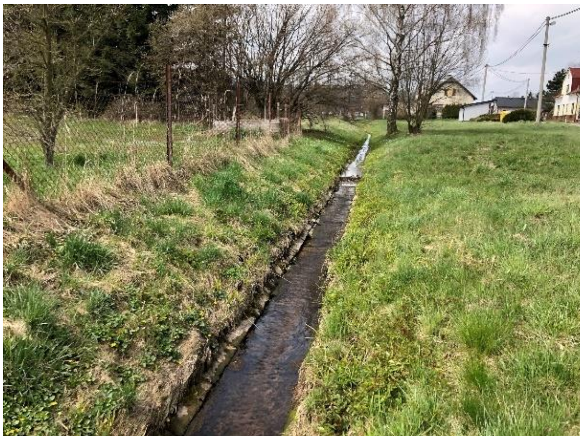
Obrázek 103 Pohled na přímou část vodního toku (ř.km 11.175 - proti proudu)