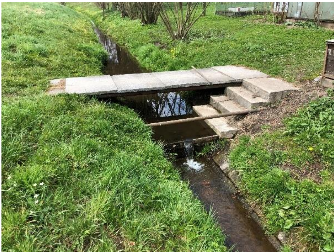
Obrázek 109 Pohled na betonovou lávku (ř.km 11.540 - proti proudu)