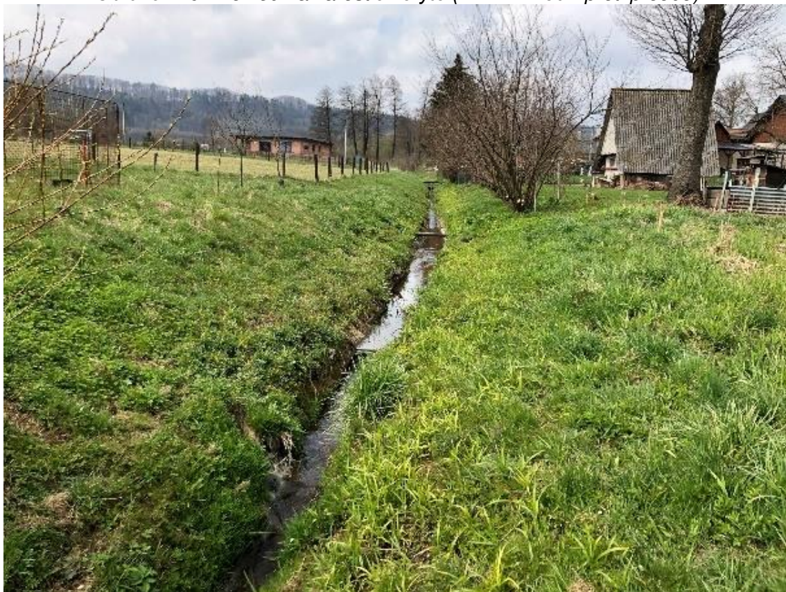
Obrázek 108 Pohled na zarostlé koryto vodního toku (ř.km 11.500 - proti proudu)