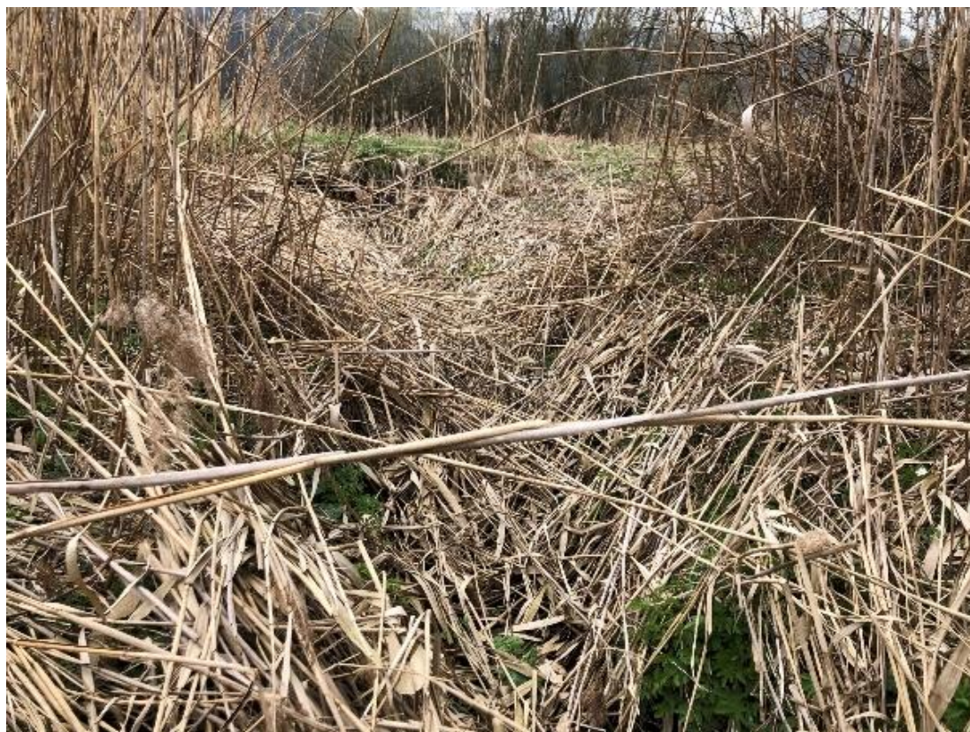
Obrázek 119 Pohled na zarostlé koryto (ř.km 11.800 - proti proudu)