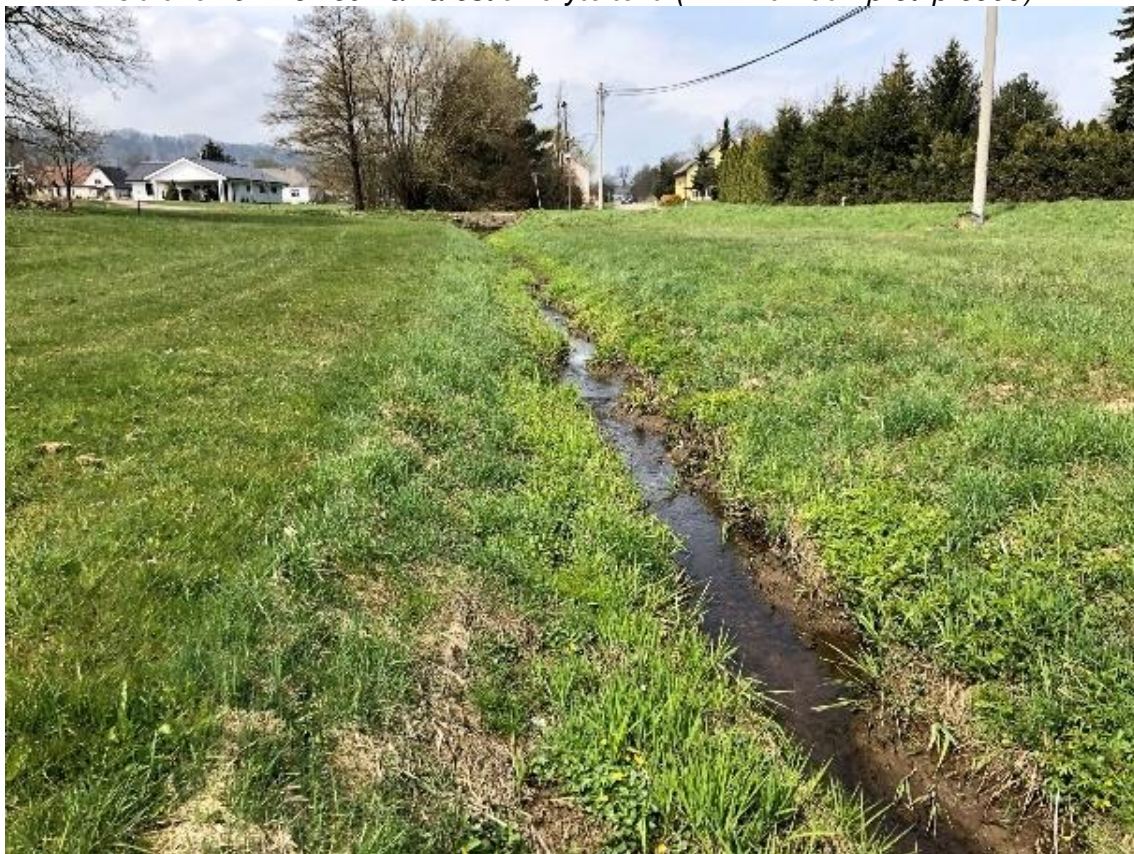
Obrázek 92 Pohled na zarostlé koryto toku (ř.km 10.740 - proti proudu)