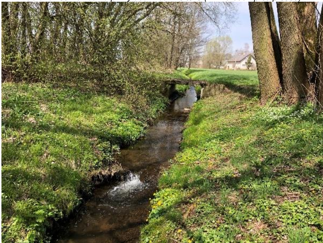
Obrázek 70 Pohled na přemostění (ř.km 9.635 - proti proudu)