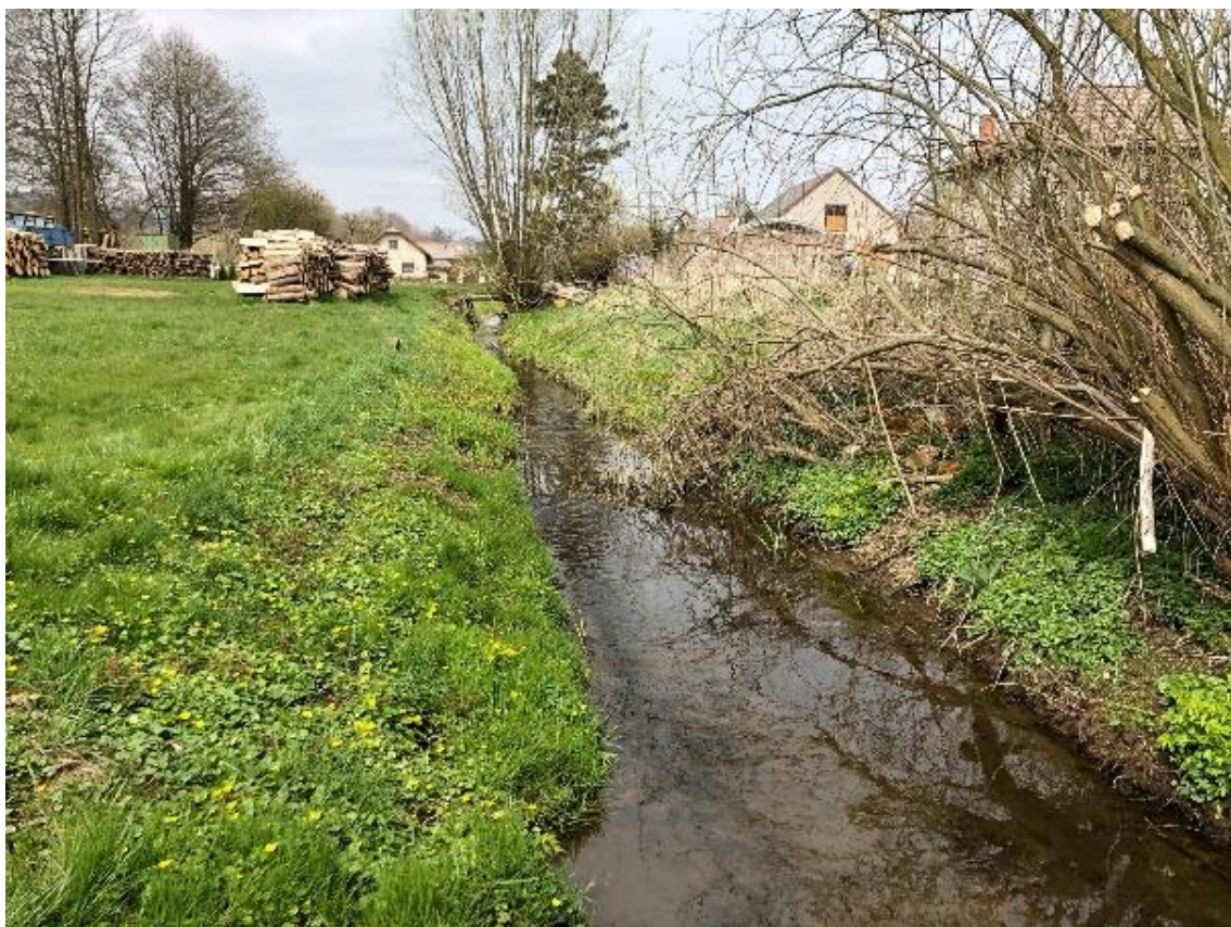
Obrázek 35 Pohled na koryto (ř.km 8.250 - proti proudu)