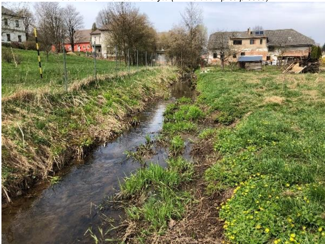
Obrázek 52 Pohled na koryto (ř.km 8.950 - proti proudu)