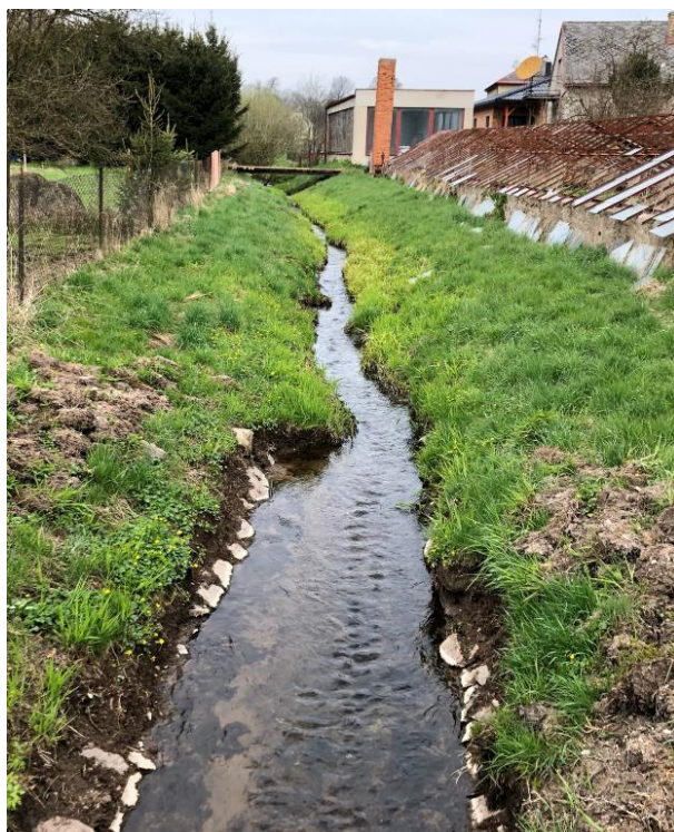
Obrázek 39 Pohled na zanesené koryto (ř.km 8.425 - proti proudu)