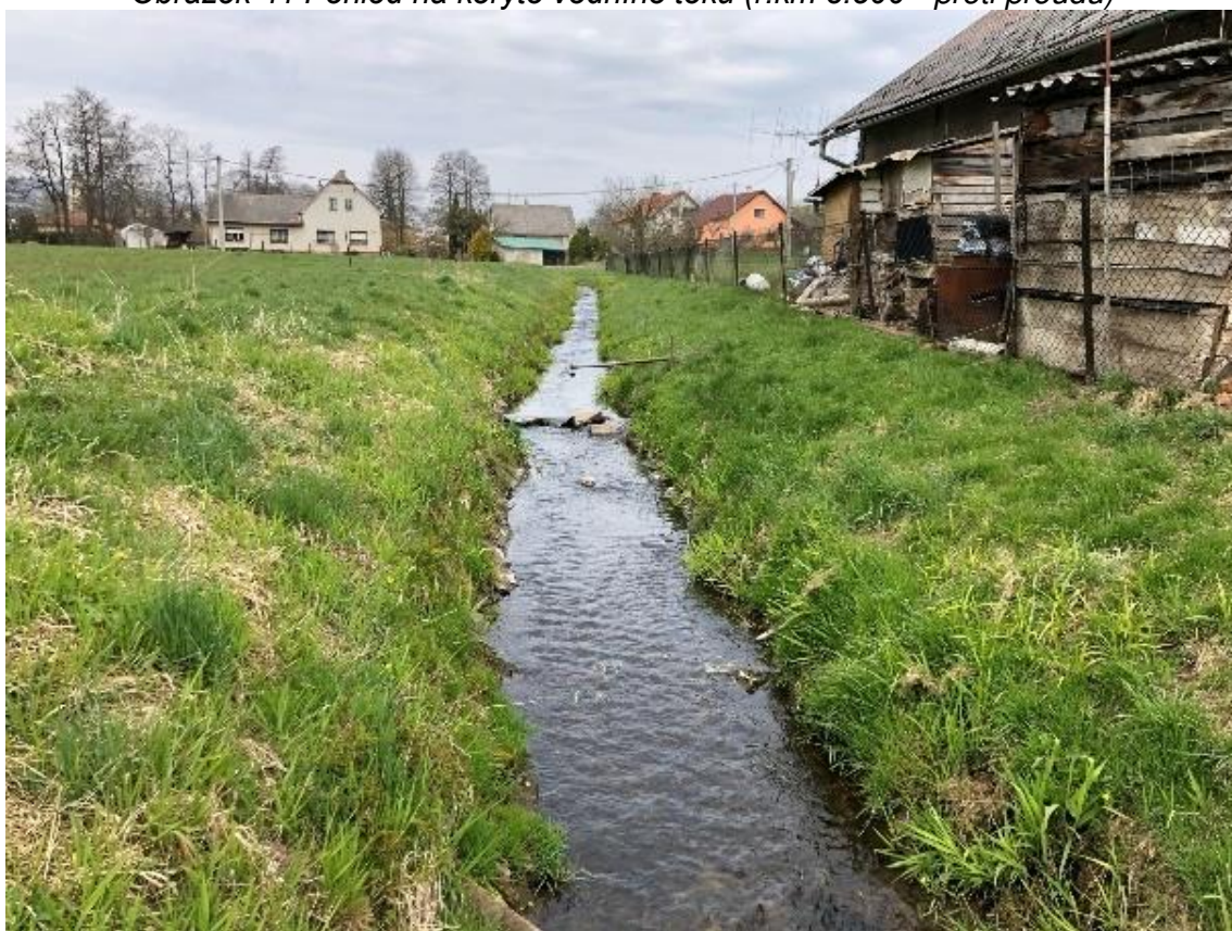
Obrázek 42 Pohled na koryto vodního toku (ř.km 8.550 - proti proudu)