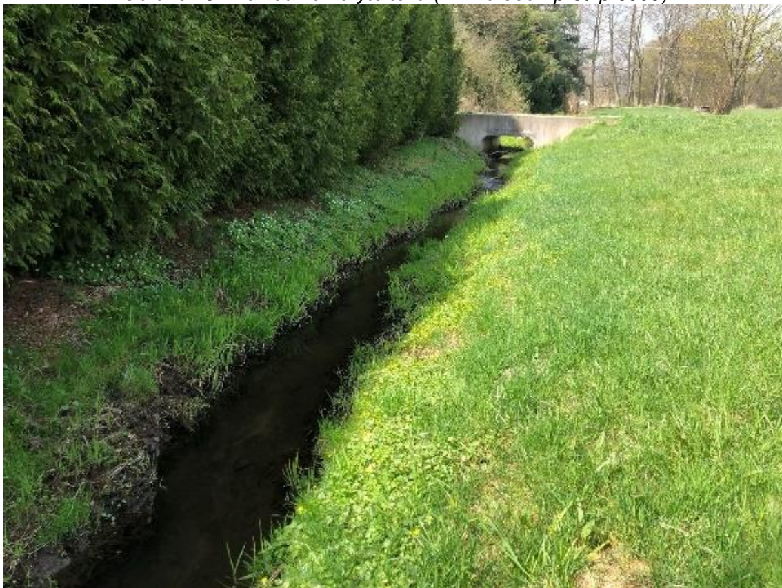
Obrázek 62 Pohled na přemostění (ř.km 9.450 - proti proudu)