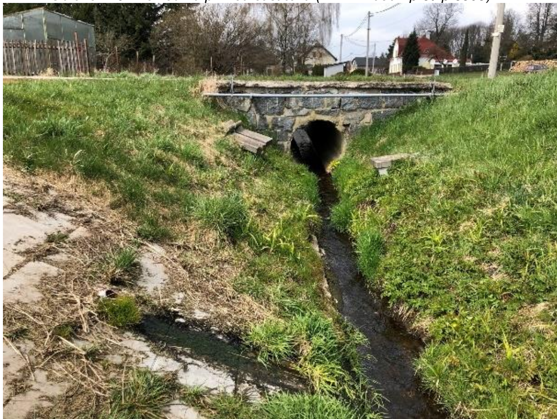
Obrázek 102 Pohled na čelo betonového propustku (ř.km 11.140 - proti proudu)